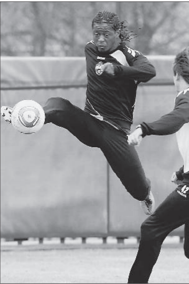
Ватутинки. Тренировка ЦСКА. В игре СЕКУ Олисе.