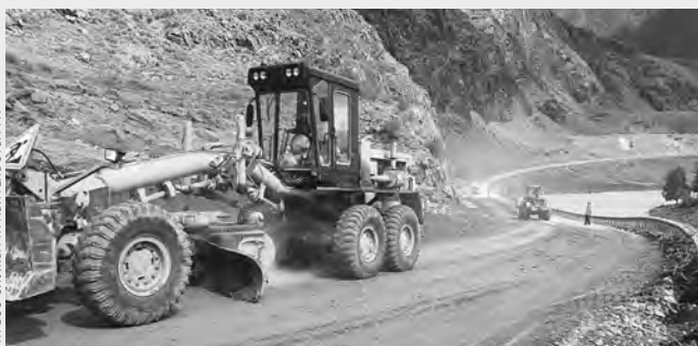
Дорожники в течение дня очистили проезжую часть от камней.

В конце минувшей недели было закрыто движение транспорта по федеральной трассе Р-256 «Чуйский тракт». Здесь после сильных ливней произошел сход селевого потока неподалеку от села Иня. В районе 710—714 километров были размыты дорожное полотно и обочина. К проезжей части подошла вода возле населенного пункта Чуй-Оозы. Дорожники оперативно справились со стихией — для расчистки трассы от камней и грязи было направлено восемь единиц спецтехники. Еще две бригады работали в зоне подтопления, чтобы предотвратить разрушение дорожного полотна. Получить актуальные данные о состоянии проезда по Чуйскому тракту можно по телефону диспетчерской службы: 8-3852-63-14-59.