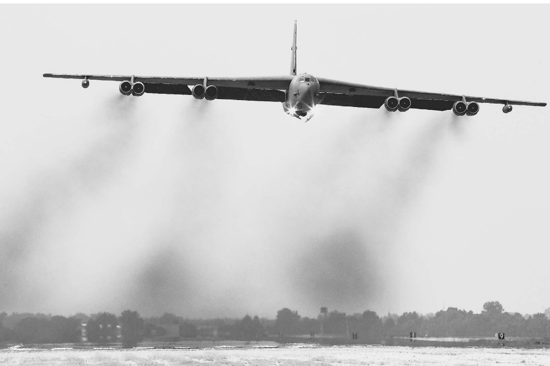
Б-52 уже более полувека стоит на вооружении Пентагона

Пентагон понес очередные потери. Многомиллионные: на острове Гуам в Тихом океане разбился легендарный бомбардировщик Б-52, который одни называют «Стратосферной крепостью», а другие — «рабочей лошадкой холодной войны». Б-52 находится на службе более полувека и за это время принимал участие во многих военных кампаниях. За всю свою историю он ни разу не применял ядерное оружие, хотя и способен нести его. → стр. 2