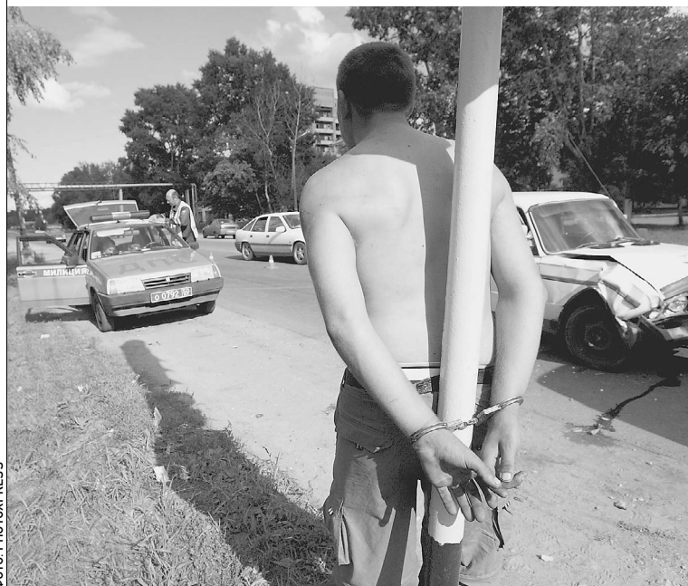
Город Серпухов Московской области. Чтобы успокоить разбушевавшегося пьяного водителя, сотрудникам ГИБДД пришлось приковать его наручниками к столбу

— У нас водители, которые находятся в состоянии алкогольного опьянения, и водители в нормальном состоянии уравнены, — с грустью отметил Нургалиев. → стр. 7