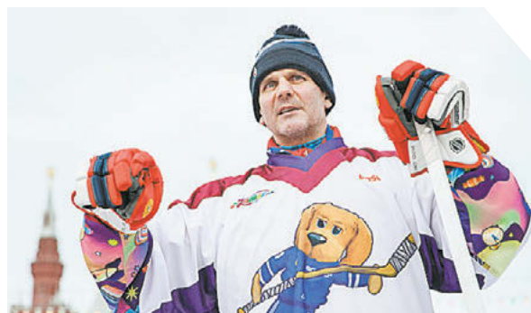
Дарья Исаева «СЭ» / Canon EOS-1D X Mark II