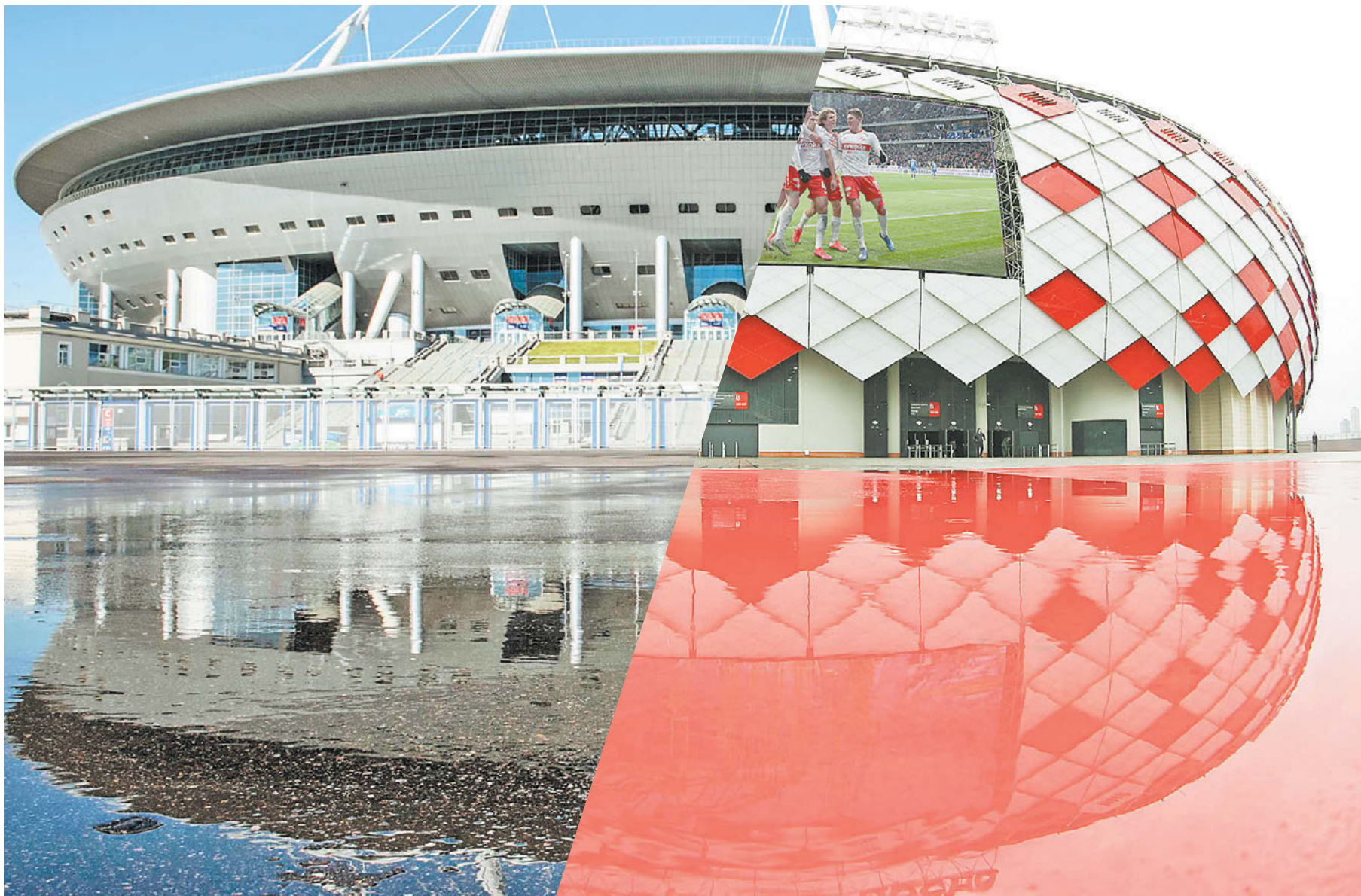
Санкт-Петербург. «Газпром Арена»

В конце апреля состоится полуфинал Кубка России с участием «Зенита» и «Спартак». Где именно пройдет этот матч – одна из интриг сезона