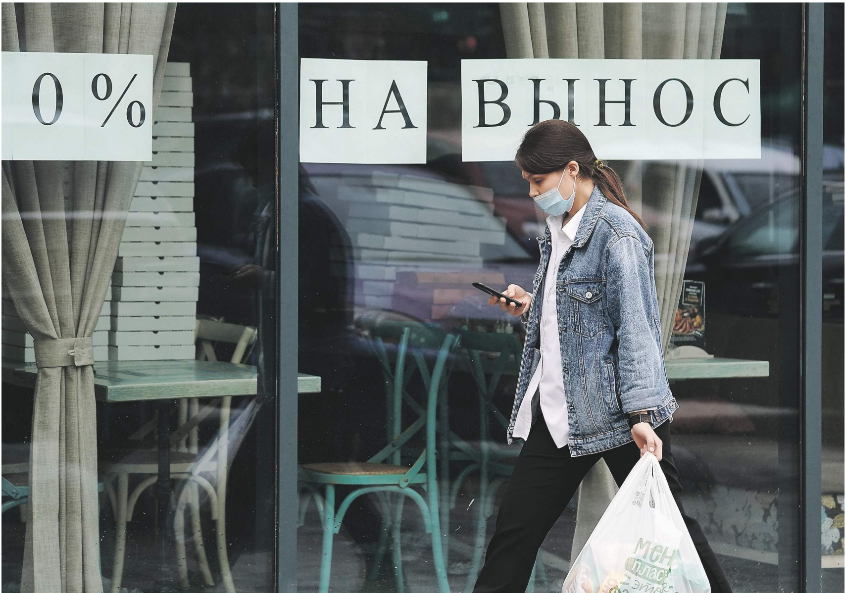
Дмитрий Коротаев / Известия