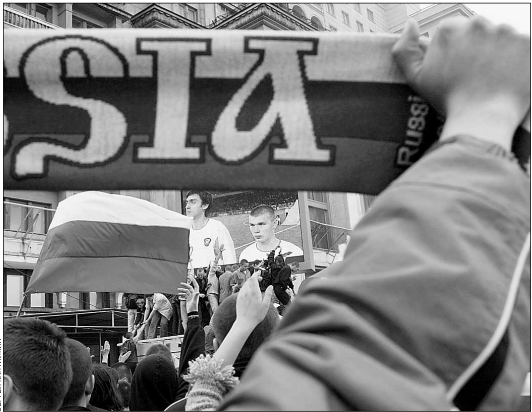
Если ничего не изменится, нам будет не за кого болеть в еврокубках