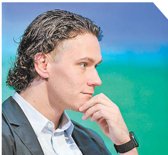
Дарья Исаева «СЭ»

Вчера появилась информация о том, что российский хоккеист «Оттавы» заболел коронавирусом. НХЛ пока не подтверждает эту новость