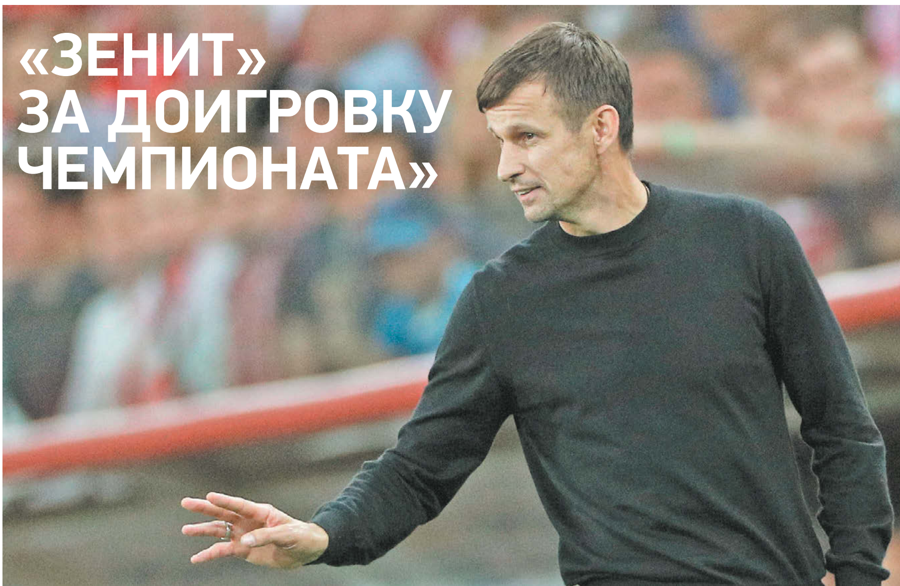
Главный тренер «Зенита» Сергей Семак

Эксклюзивное интервью главного тренера сине-бело-голубых на самые актуальные темы последних дней