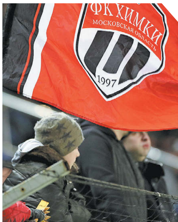
Дарья Исаева «СЭ» / Canon EOS-1D X Mark II