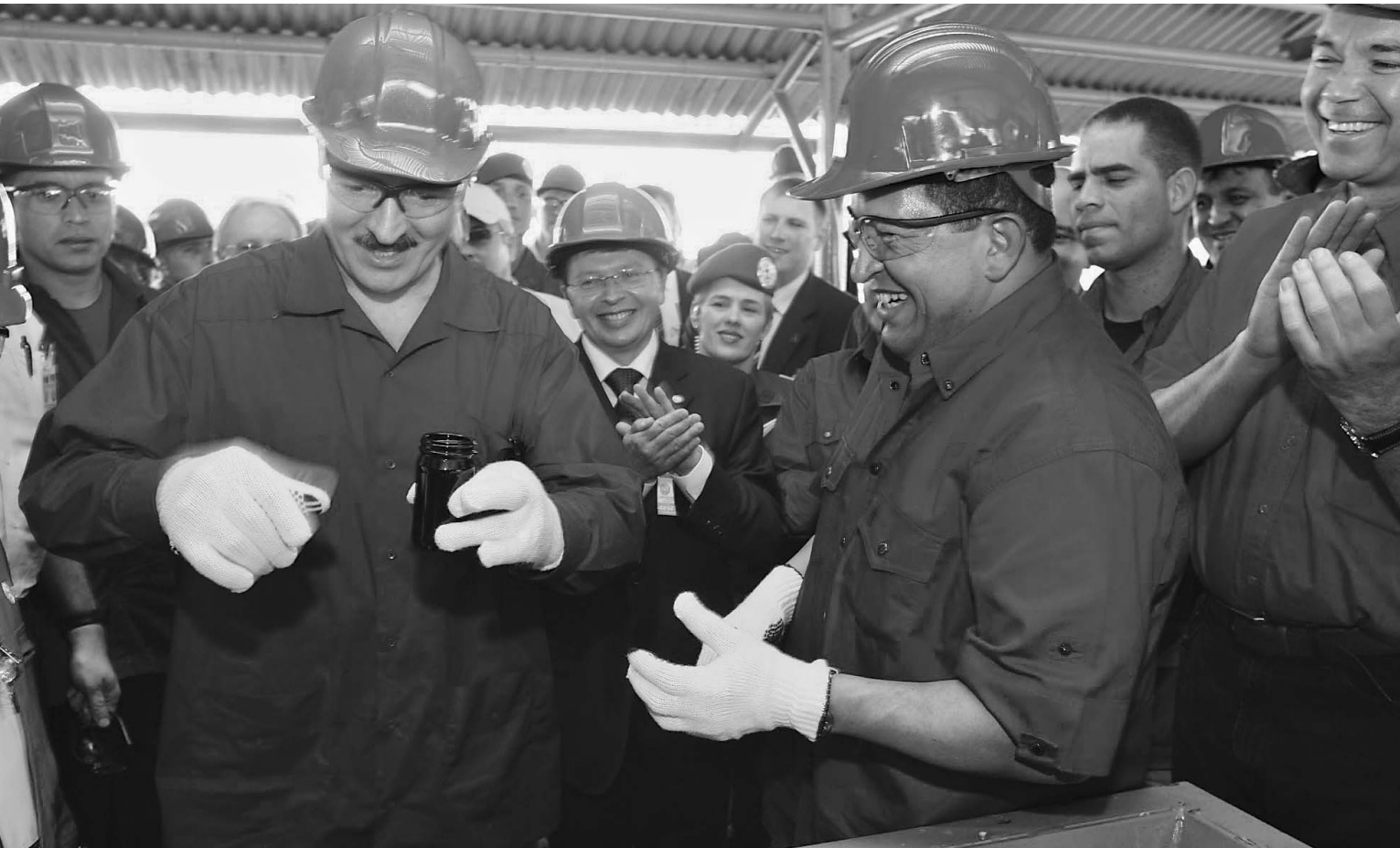
Александр Лукашенко прицелился к «черному золоту» Латинской Америки

Белоруссия снова идет на обострение отношений с Россией?