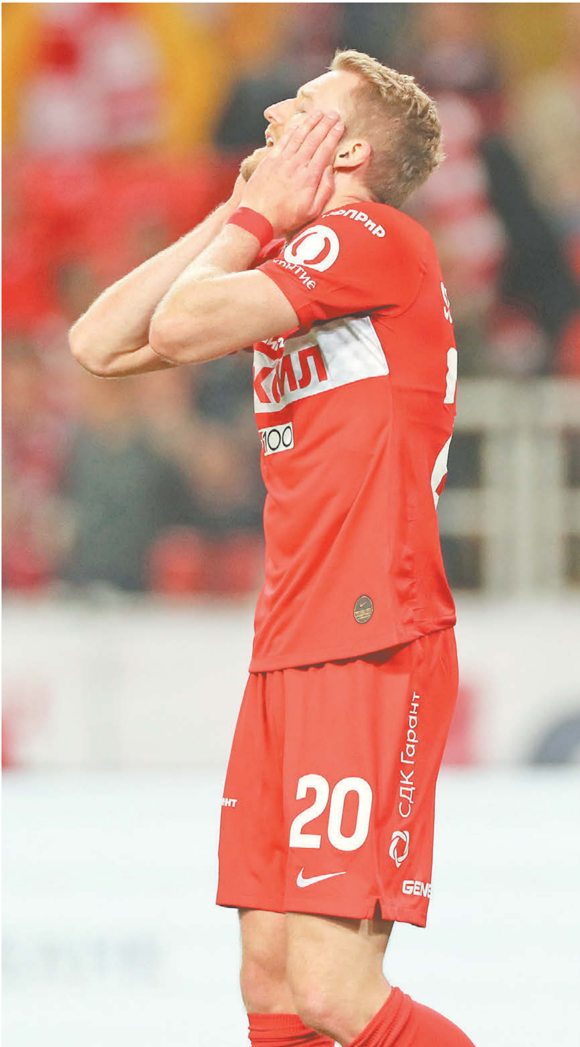
«Спартак» не будет выкупать Андре Шюррле у дортмундской «Боруссии»