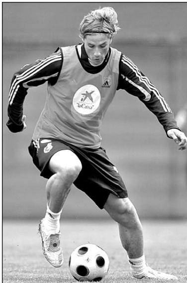
Суббота. Нойштифт. ФЕРНАНДО ТОРРЕС на тренировке сборной Испании.

- Дополнительного психологического напряжения, поверьте, не ощущаю. Приятно, что люди верят