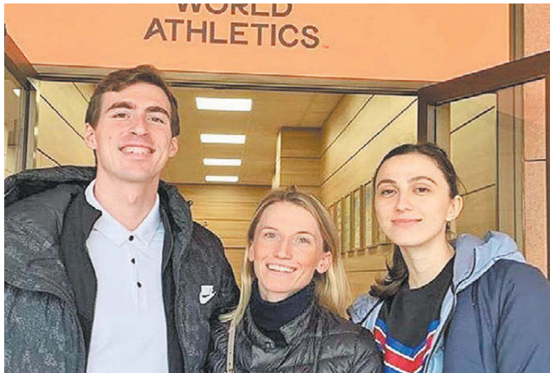
Сергей Шубенков, Анжелика Сидорова и Мария Ласицкене (слева направо)