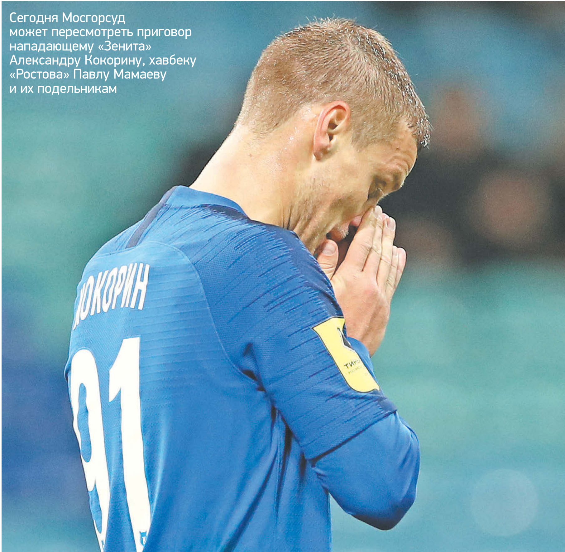
29-летний форвард «Сочи» Александр Кокорин

Сегодня Мосгорсуд может пересмотреть приговор нападающему «Зенита» Александру Кокорину, хавбеку «Ростова» Павлу Мамаеву и их подельникам