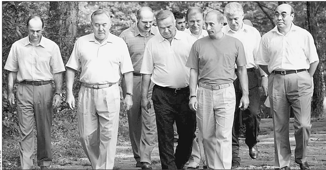
Вчера президенты весь день пытались быть похожими на обыкновенных курортников

договорились о создании пяти новых совместных предприятий, которые дадут 10 тысяч дополнительных рабочих мест. С другими сложнее — обильные неформальные договоренности никак не могут дойти до стадии юридического оформления. Украина, например, чуть меньше года назад устами своего президента пообещавшая перевести газовую задолженность в разряд государственного долга, выполнять свое обещание не торопится. Идея здорового эгоизма была успешно воспринята и другими соседями России. Белоруссия, приняв к сведению намерение Москвы установить единые правила игры со странами СНГ, все же смогла добиться исключений из порядка визитов НДС. Вчера Владимир Путин как раз общался с глазу на глаз и с Александром Лукашенко, и с Леонидом Кучмой. Ради последнего на сочинской политической сцене появился Виктор Черномырдин — в решении газовых проблем в ход пошла тяжелая артиллерия.