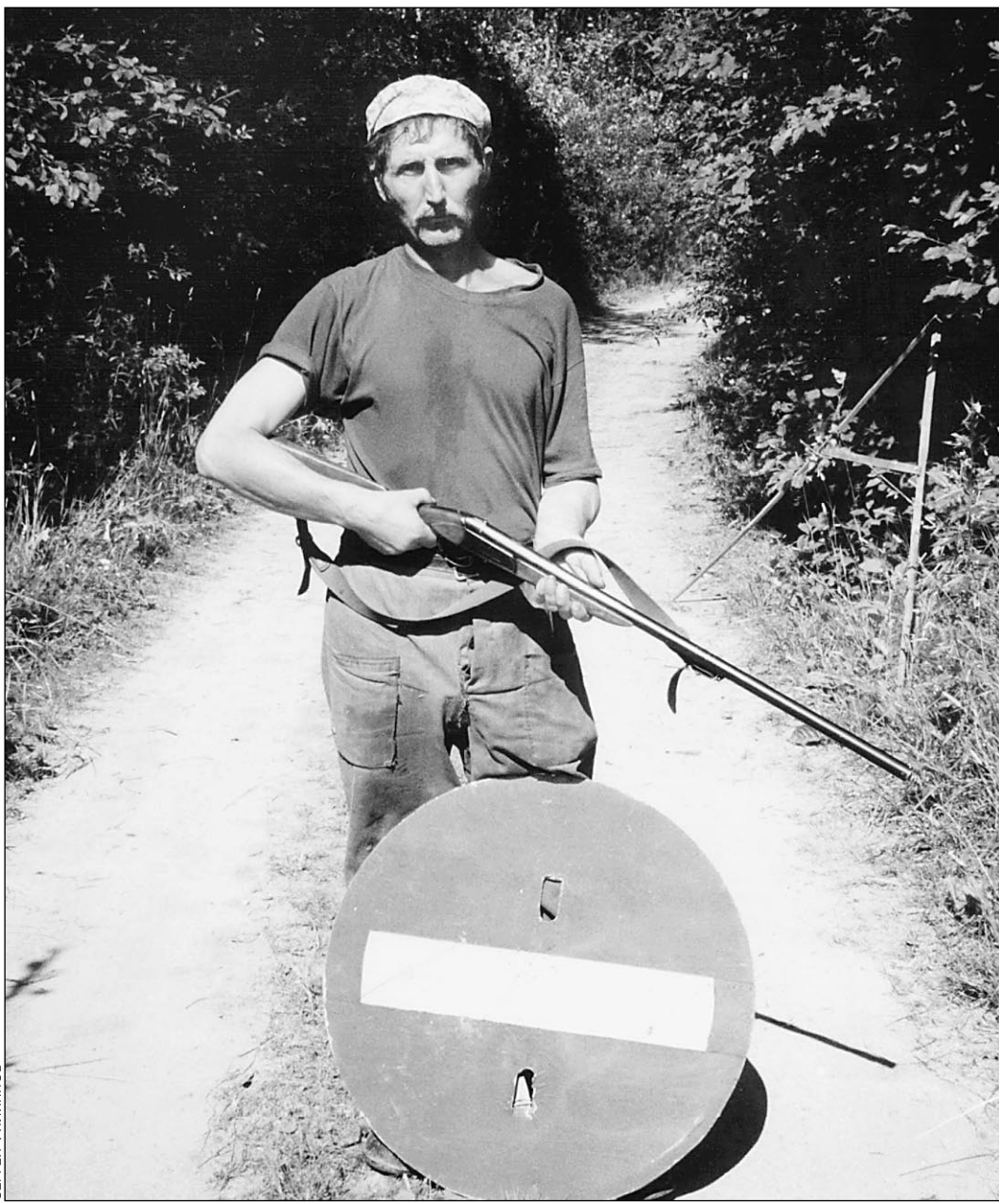
Кто не спрятался — я не виноват

Правительство подготовило программу успокоения граждан