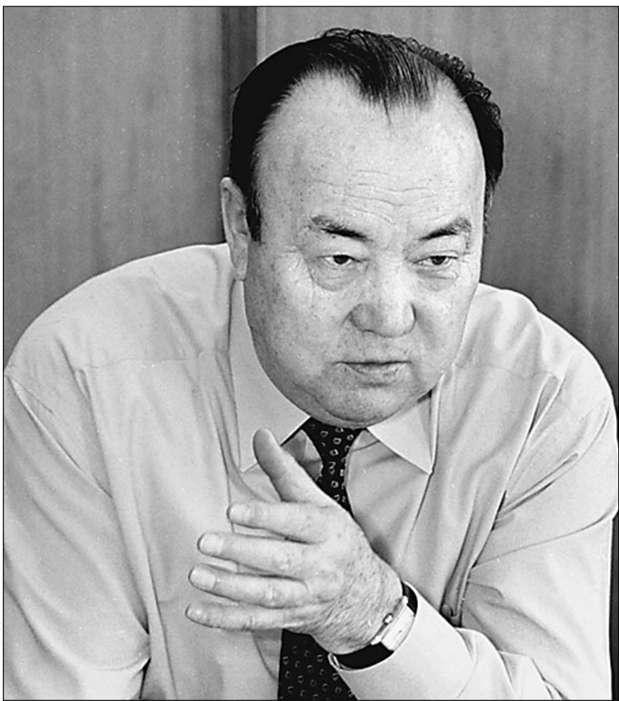
Президент Башкирии Муртаза Рахимов и президент Швейцарии Каспар Филлигер: неразделенное горе

Да, швейцарские авиадиспетчеры, пытаясь спасти «честь мундира» и сваливая вину на по-