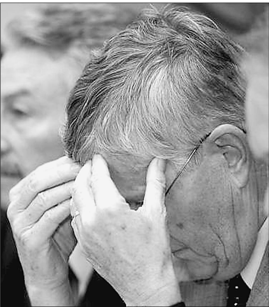
Президент Башкирии Муртаза Рахимов и президент Швейцарии Каспар Филлигер: неразделенное горе