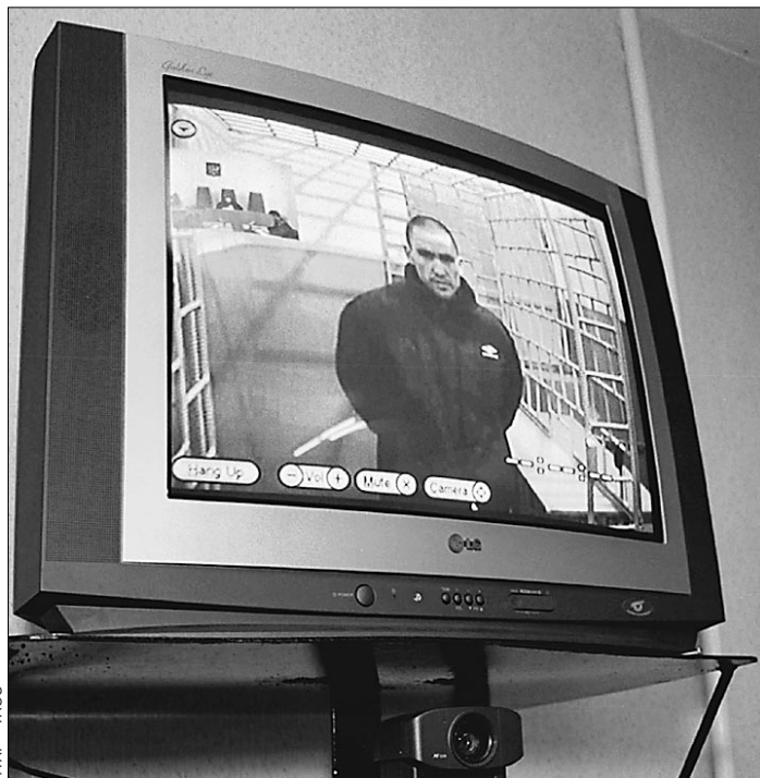
Телемост «Курганский городской суд» — СИЗО № 1

Станет ли наш суд самым гуманным в мире 7