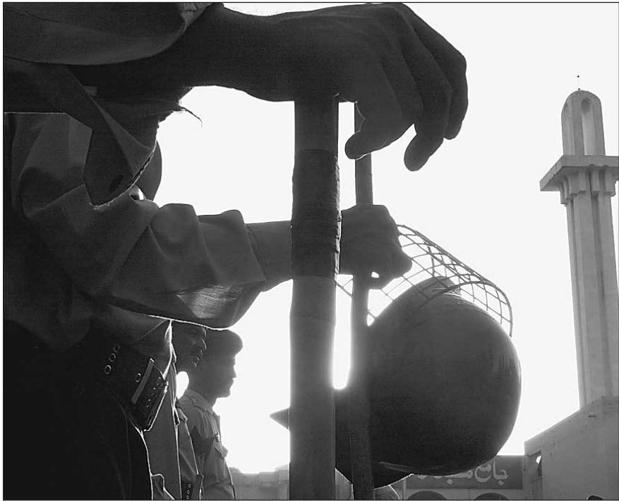
Интер — нет!

В 2000 году Минюст РФ вынес Адыгее предупреждение в связи с деятельностью, противоречащей