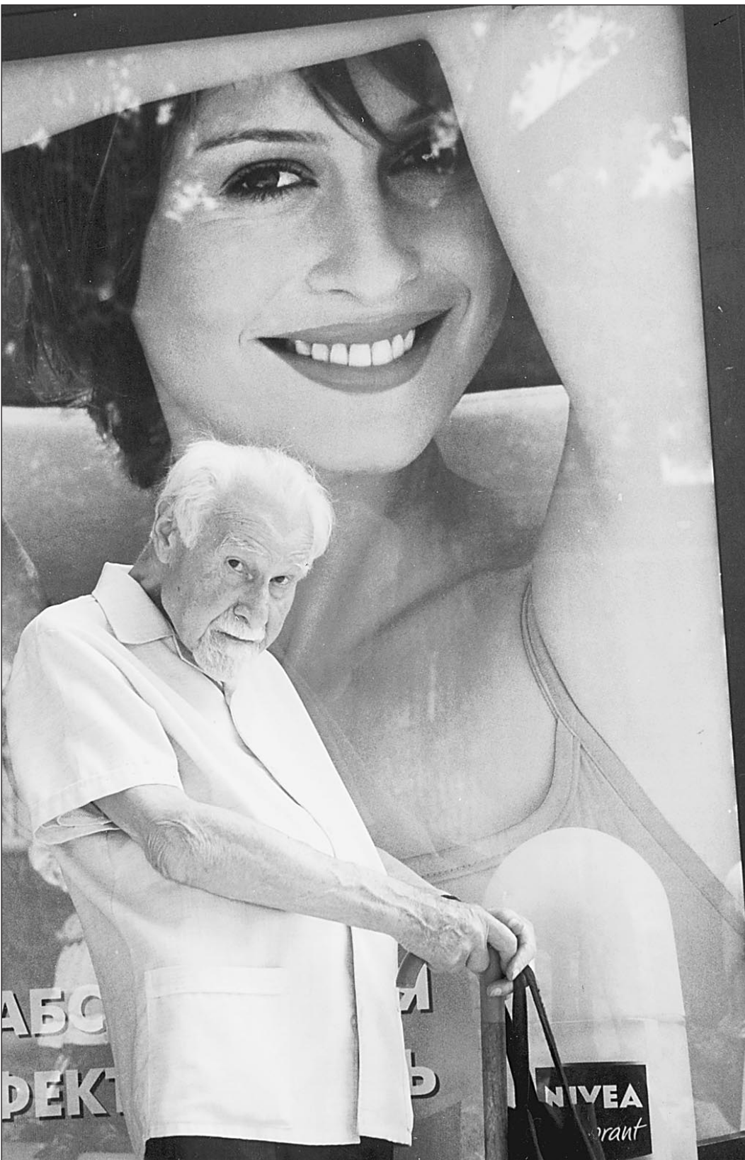
По дороге к цивилизованному развитию