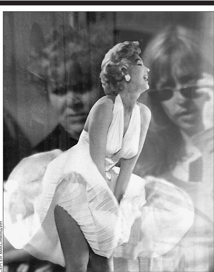
Она знала, что такое свобода