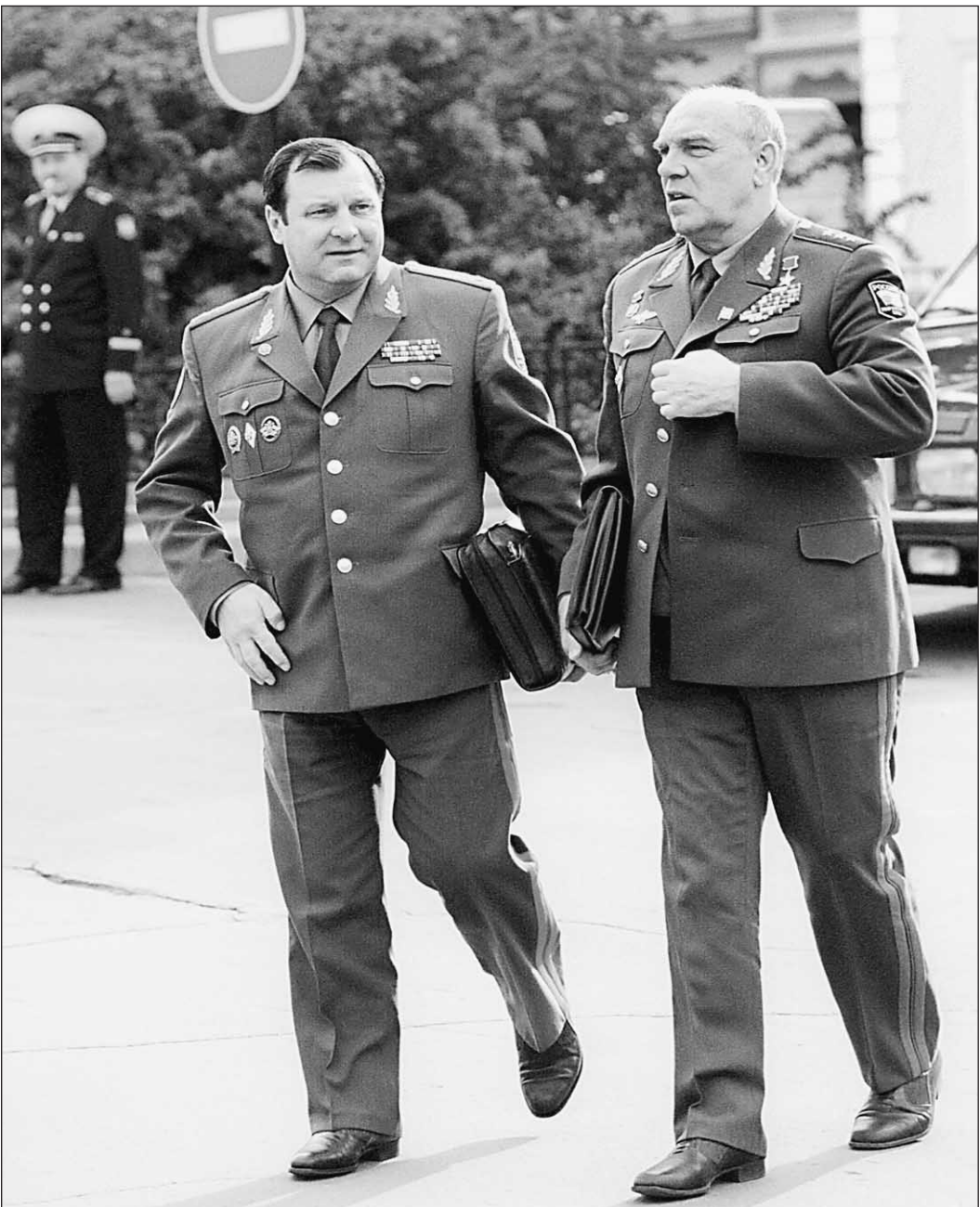
22 мая. Москва. Генералы направляются на сборы высшего командного состава Министерства обороны

Позицию старшего, воспитанного еще в советских академиях поколения в отношении нового Договора по СНВ высказал замначальника Генштаба Вооруженных сил России Юрий Балуевский, который и вел долгое время переговоры с американцами: «Это не то, что мы хотели». Министр обороны Сергей Иванов, который ранее уже говорил, что договор не