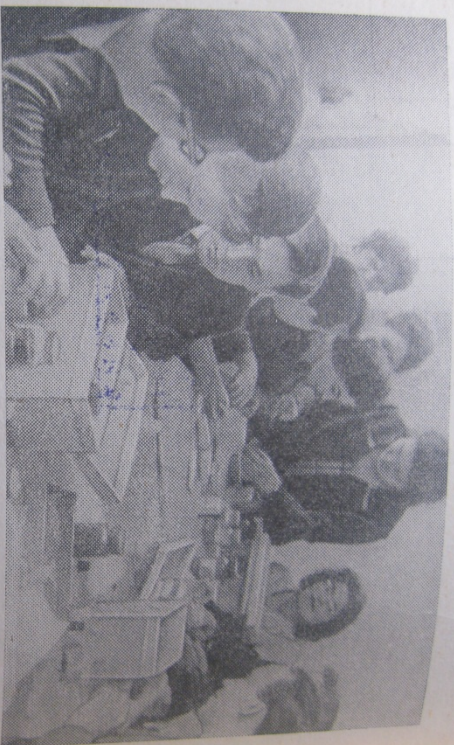
Кабинет криминалистики прокуратуры