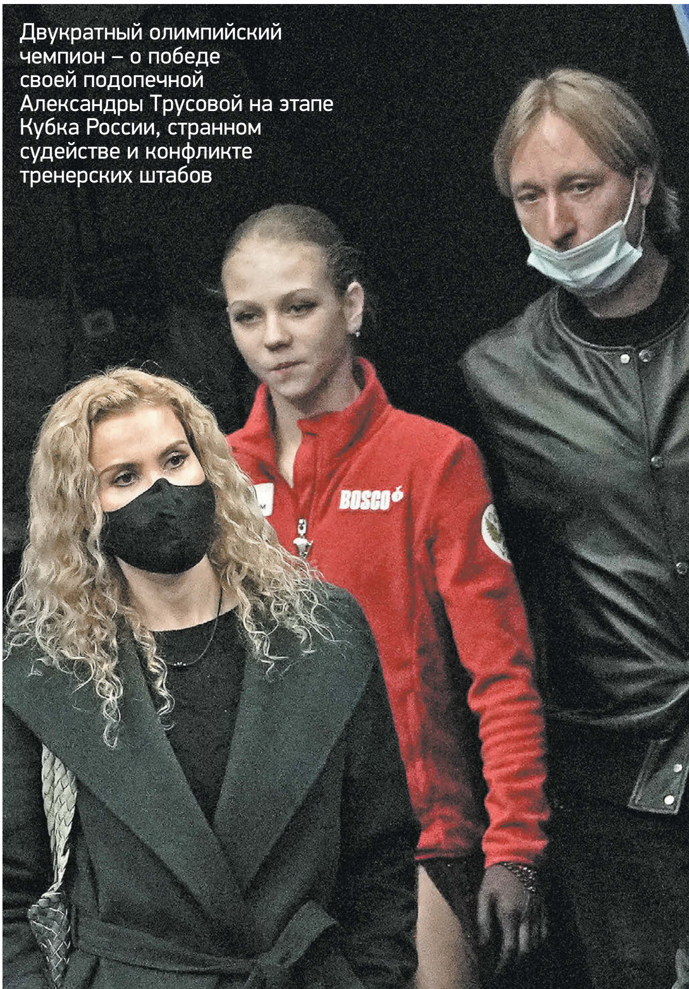
11 октября. Москва. Этери Тутберидзе (слева), Александра Трусова и Евгений Плющенко

Двукратный олимпийский чемпион – о победе своей подопечной Александры Трусовой на этапе Кубка России, странном судействе и конфликте тренерских штабов