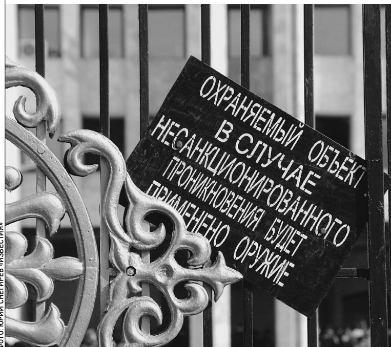
Охраняемый объект — это Дом правительства Киргизии

Austria 2.0 € Belgium 2.0 € Czech republic 1.40 € Greece 2.0 € Italy 2.0 € Great Britain 1.40 € Luxembourg 2.0 € Hungary 700 huf Sweden 18 sek Slovakia 2.10 € Turkey 4,25 ytl