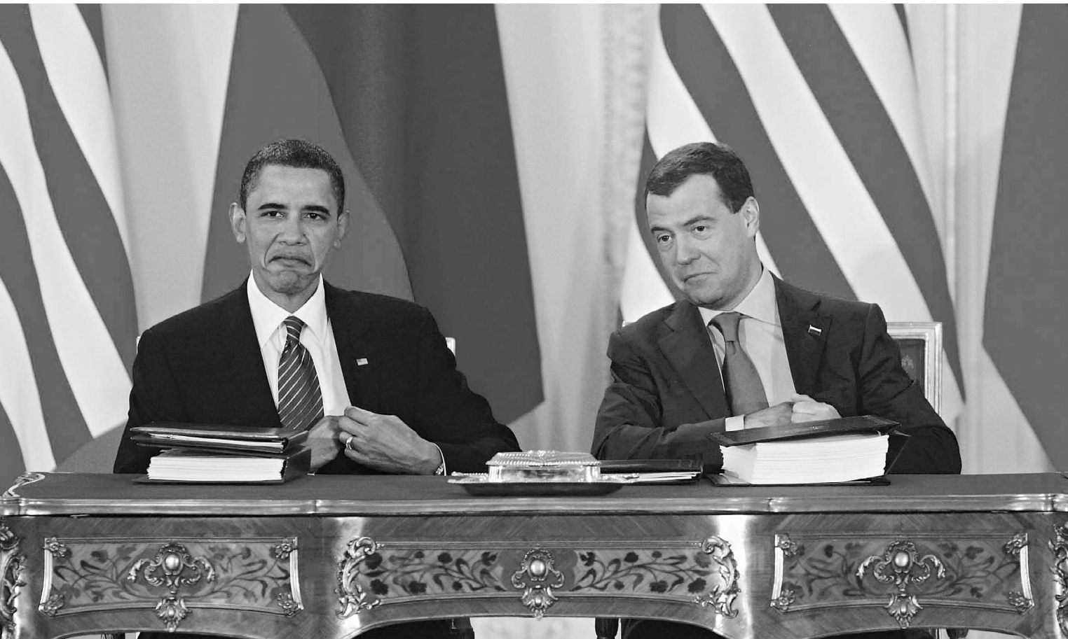
Договор, подписанный Барак Обама и Дмитрием Медведевым, наверняка войдет в учебники истории

Россия и США начинают на практике разоружать мир