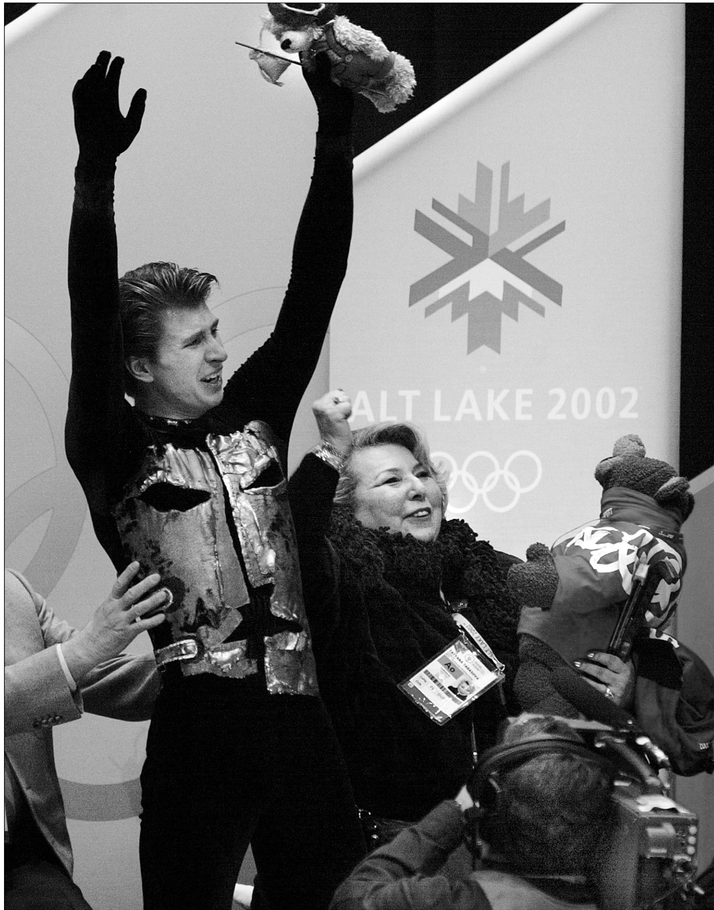
14 февраля 2002 года. Солт-Лейк-Сити. Последний — и решающий — старт Алексея ЯГУДИНА на любительском льду. Спортсмен и его тренер Татьяна ТАРАСОВА празднуют победу на Олимпиаде.

Полностью интервью с Ягудиным — в одном из ближайших номеров