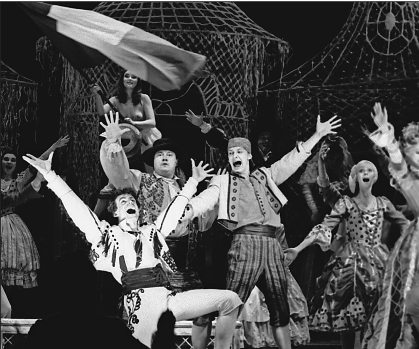
«Ленком». Сцена из спектакля «Безумный день, или женитьба Фигаро»

Захарова то и дело вызывали на райкомовский и горкомовский ковер и вели с ним серьезные беседы. Дело было не только в спектаклях: Захарова, как и Тилия, тянул за язык черт, и режиссер постоянно говорил что-то неподобающее.