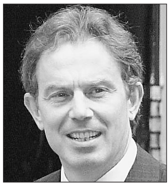
чтобы сплести острые углы в самых непростых вопросах.

— Очевидно, что события 11 сентября подчеркнули жизненно важное значение совместной работы. Для решения таких глобальных проблем, как угроза международного терроризма, необходимо всеобщее сотрудничество. Нам необходимо воображение и дерзновение, чтобы пробиваться через преграды стереотипов прошлого. Меня очень вдохновляет тот конструктивный подход, который президент Путин готов проявлять,