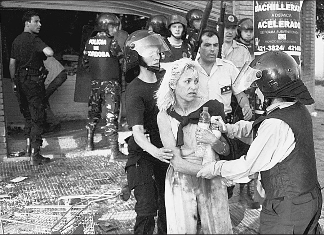
20 декабря. Беспорядки в Буэнос-Айресе