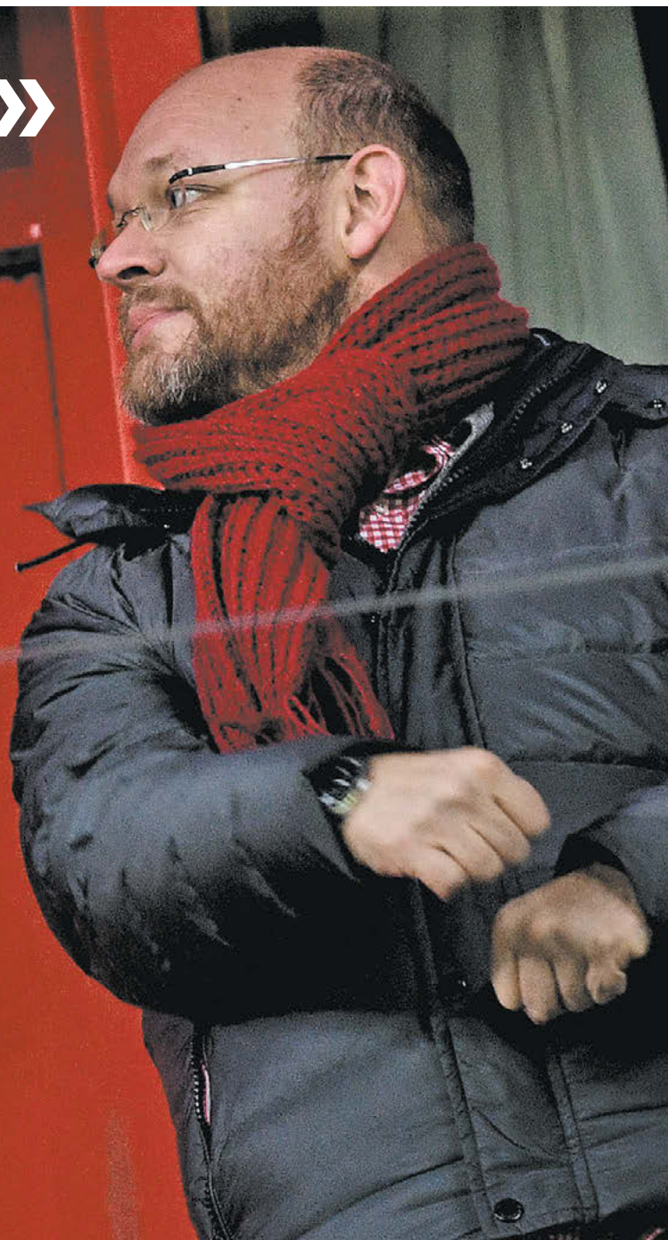
Дарья Исаева «СЭ»

Бывший президент железнодорожников стал гостем эфира «СЭ». Перед вами – первая часть откровенного интервью