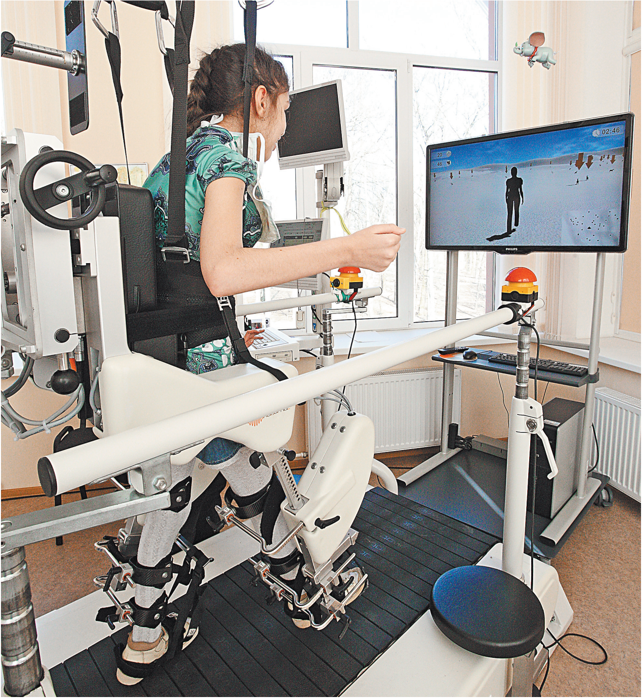
Союзная программа по новой методике лечения детей с тяжелыми деформациями позвоночника — одна из шести, которые планируется профинансировать из союзного бюджета в 2017 году.

Оксана Вячеславовна, минул год, как вы возглавили Совет автономии «Белорусы Москвы». Срок небольшой, но вот уже и медаль от Президента Беларуси на вашей груди. Что удалось сделать за столь короткое время?