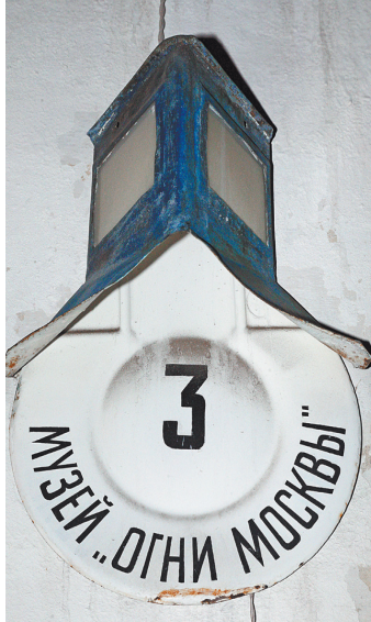
Музей расположился между Маросейкой и Мясницкой.

Такие фонари появились в Москве после указа императрицы Анны Иоанновны 27 ноября (по старому стилю) 1730 года. В жестяном «кошачке» под стеклянным коробом коптил нитяной фитилек, пропитанный конопляным маслом. На ночь отпускаялось по 24 золотника масла (один золотник — 4,266 грамма), но большинство улиц Белого города и окрину погружались в крошечную тьму уже к полуночи — смышленные фонарищи.