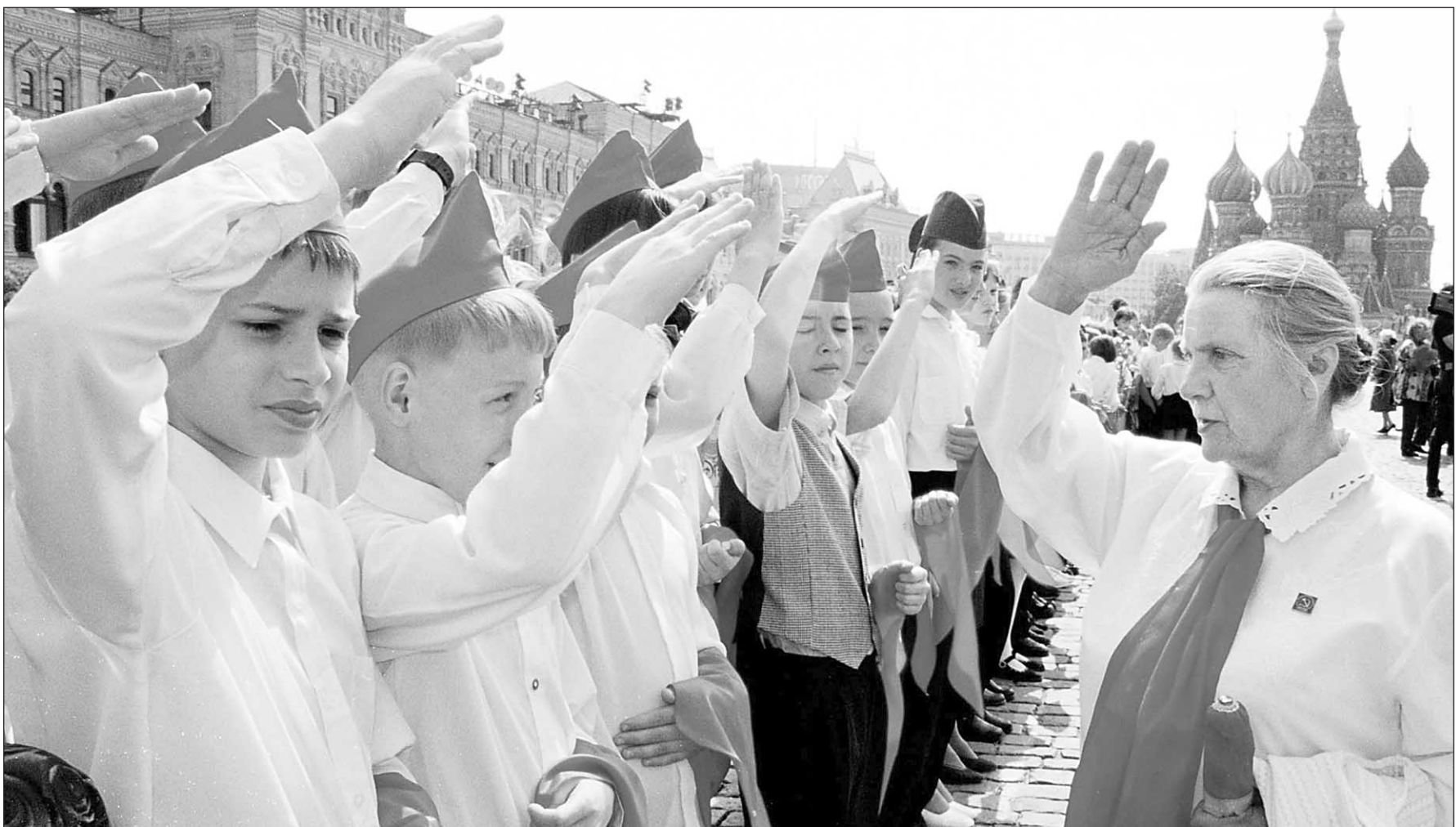
Ко всему готовы!

Противоречие между сверхцентрализованной идеологией и свободной экономикой порождено самой российской реальностью; винить в этом нынешнюю властную элиту глупо. Если вы