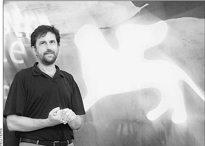
Президент жюри Венецианского кинофестиваля Нанни Моретти

Старт кинофестиваля оказался вялым и беззвездным