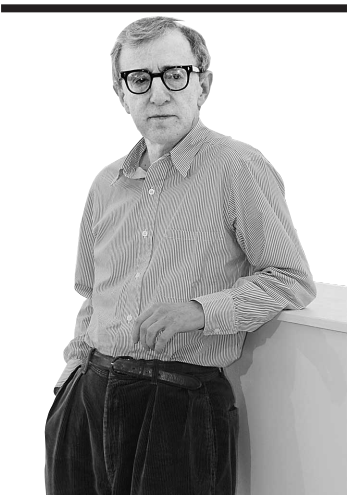
Вуди Аллен представляет читателям «Известий» свой фильм «Голливудский финал»:

— Я действительно старался сделать такой фильм, словно его снимал слепой. Отсюда, например, некоторая статичность сцен. Еще я хотел создать образ Нью-Йорка до 11 сентября. Хотел, чтобы именно таким запомнился Нью-Йорк французам, итальянцам, испанцам, русским — всем. Что до ситуации, когда фильм, снятый моим слепым героем, оценили именно во Франции, то это ведь отражение реальности. Настоящих американских мастеров — будь то в литературе, кинематографе или даже джазе — очень часто оценивают за пределами Америки прежде американцев. И главным образом во Франции. Концовка моего фильма, когда именно французы признают картину моего героя талантливой, это жест благодарности по отношению к французской публике за годы истинной поддержки. Я не разделяю позиции Американского еврейского конгресса по поводу Франции, где она обвиняется в растущем антисемитизме. Я не верю в это. Я никогда не чувствовал во французях никакого антисемитизма.