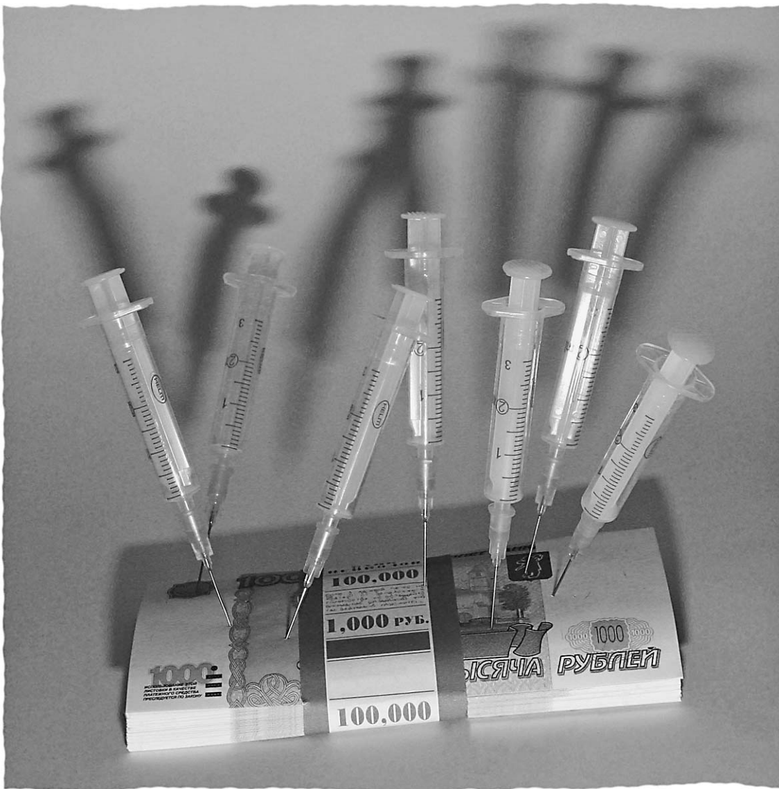
ИЛЛЮСТРАЦИЯ: КОНСТАНТИН ВАЛОВ

После того как Дмитрий Медведев потребовал от правительства новых мер по борьбе с инфляцией, в Белом доме закипела работа. Чиновники спешно ищут новые способы борьбы с ростом цен. Дело это для них привычное — таким поиском они занимаются уже несколько лет. Тем не менее в ближайшее время кабинет министров выдаст новую, самую последнюю порцию экстренных мер. Пообщавшись с чиновниками, «Известия» решили собрать воедино все предложения, которые сейчас горячо обсуждаются в кабинетах правительства. Оказалось, что среди них есть и скандальные, и просто опасные.