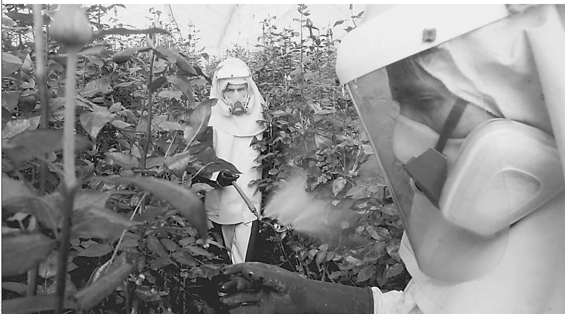
Чтобы урожай удался, европейцы обильно ОБРАБАТЫВАЮТ ПОСАДКИ УДОБРЕНИЕМ

ность. Всего месяц назад Россия и ЕС договорились о новых, более жестких правилах контроля. И теперь из-за пестицидов торговля с Европой вообще может быть прекращена. → стр. 7