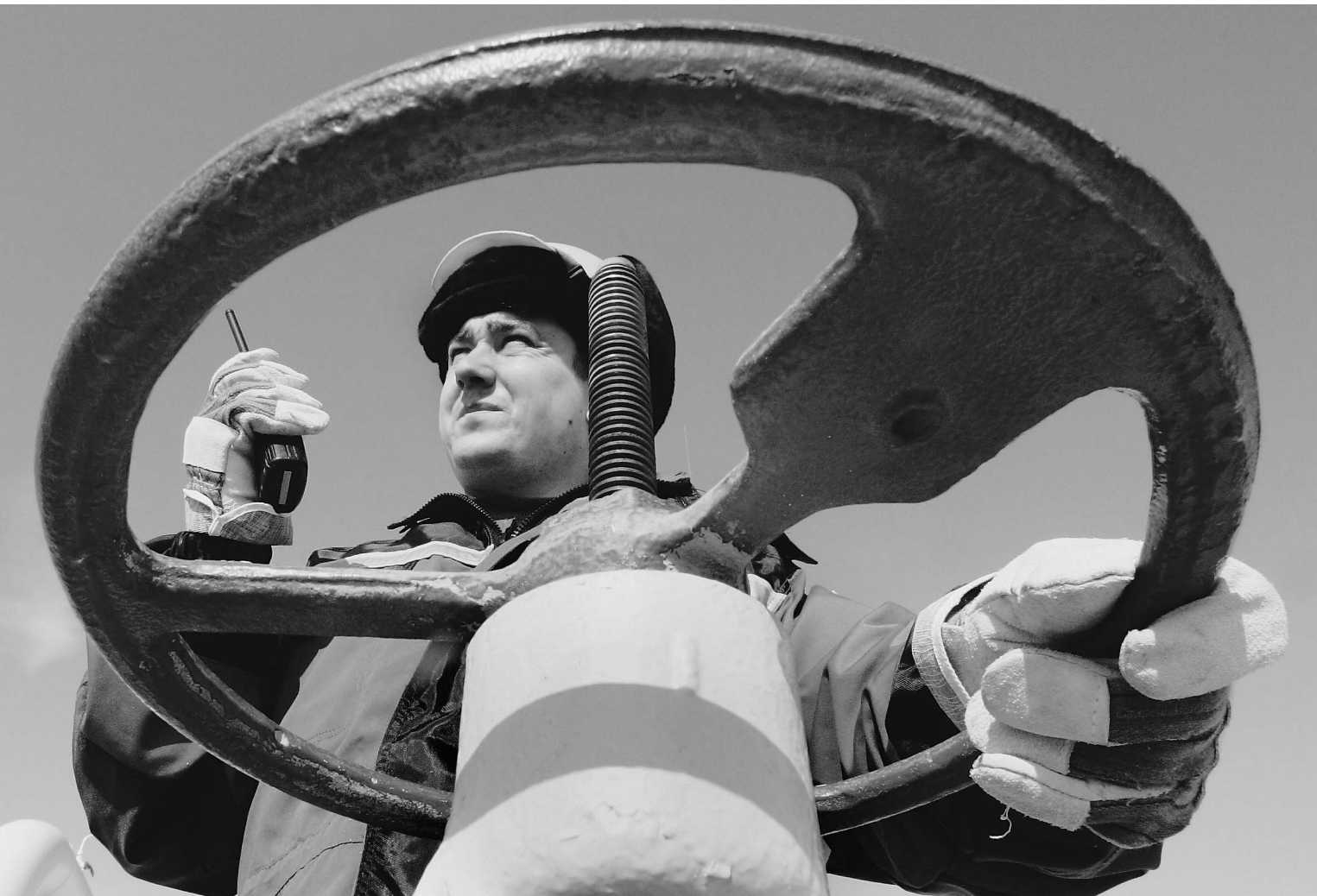
Зарплаты россиян вырастут только после того, как повысится производительность труда

Дальнейшее повышение зарплат может уничтожить отечественное производство