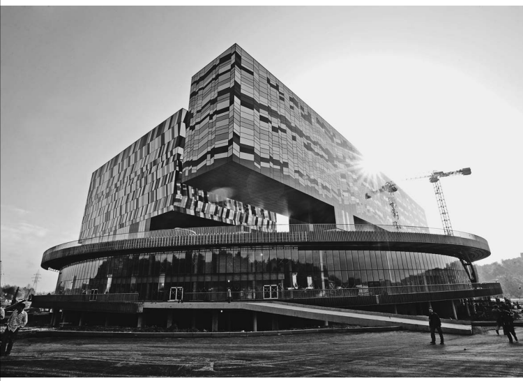
Школа управления «Сколково», возможно, будет готовить специалистов по управлению инновационным бизнесом

Президенты России и Украины Дмитрий Медведев и Виктор Янукович с пользой провели минувшие выходные. Лидеры приняли участие в автопробеге Санкт-Петербург—Москва—Киев, проехав за рулем своих автомобилей «Победа» 50 километров трассы в Брянской области. В этот же день они провели переговоры в резиденции российского президента «Завидово», в Тверской области.