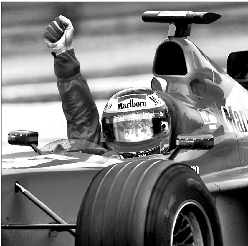
Вчера. «А1 ринг». Эдди ИРВИН - триумфатор «Гран-при Австрии».