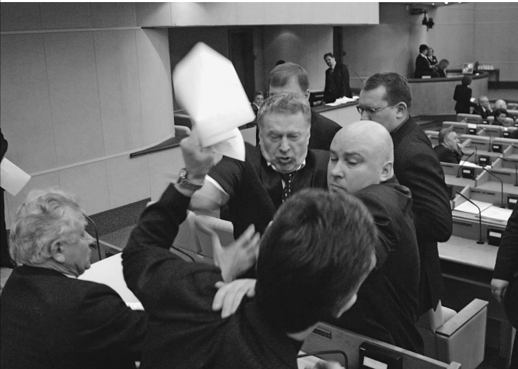
Теперь придется контролировать эмоции, чтобы не нанести ущерб репутации своего ведомства