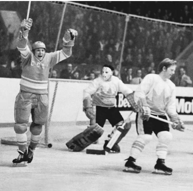
Нападающий Александр Мальцев празднует гол в ворота канадцев в одном из матчей Суперсерии-72

Инициатива премьер-министра России Владимира Путина о проведении ремейка знаменитой Суперсерии-1972 между сборными СССР и Канады стремительно обретает популярность. В ближайшие дни герой тех матчей, а ныне президент российской федерации хоккея Владислав Третьяк будет встречаться по этому поводу с визави из НХЛ. Пока технические детали находятся в стадии согласования, «Известия» решили выяснить, как сложились судьбы участников легендарных матчей.