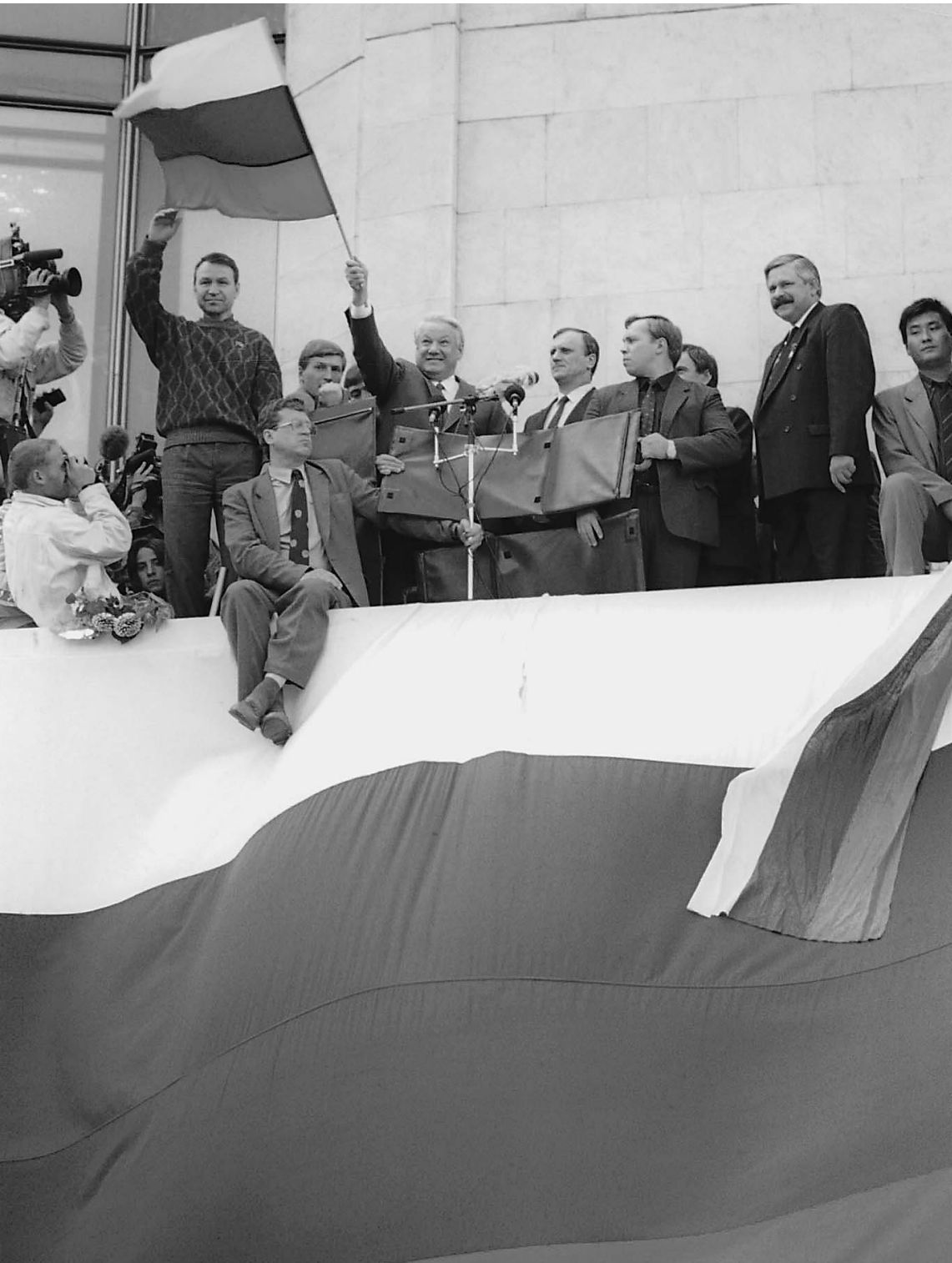
Триколор, побывав в руках президента России Бориса Ельцина на балконе Белого дома в дни августовского путча 1991 года, тогда же стал официальным символом страны

Государственный символ России мог бы стать украшением одной из центральных площадей столицы