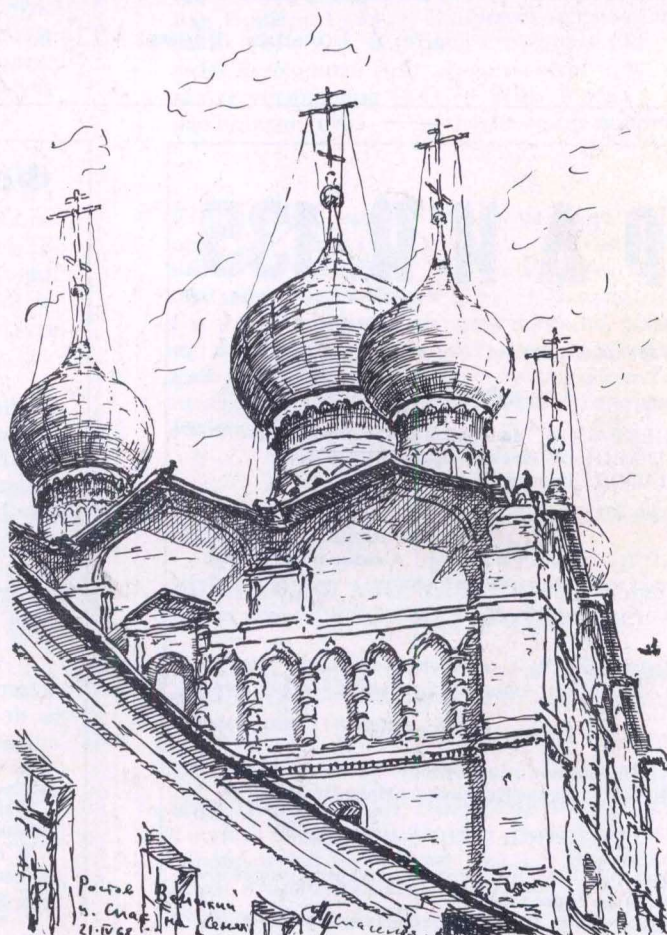
Храм Спаса на Сенях. Ростов Великий