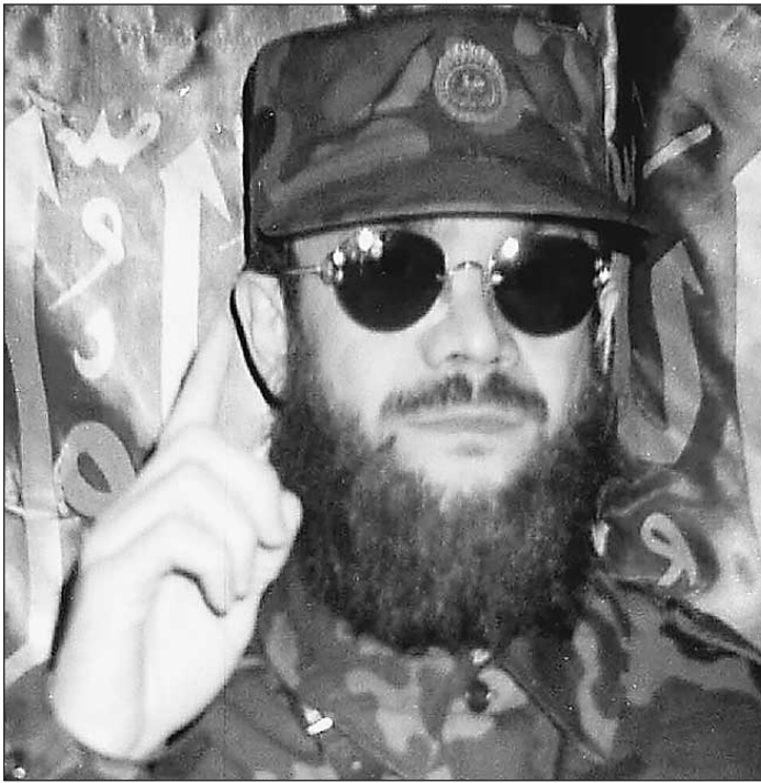
Первая перемена внешности