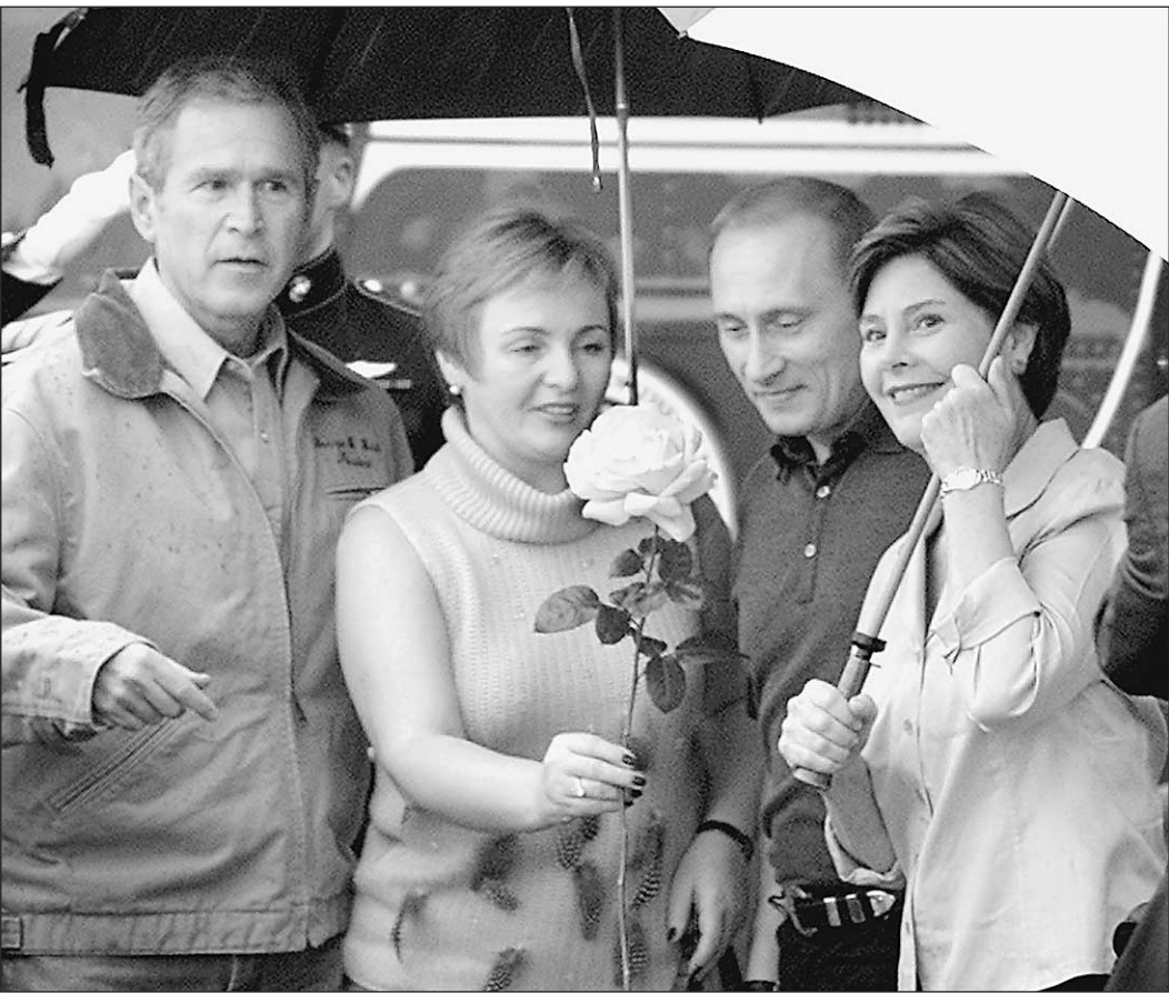
Путин приехал на ранчо к Бушам в дождь. Дождь не помешал хорошему вечеру