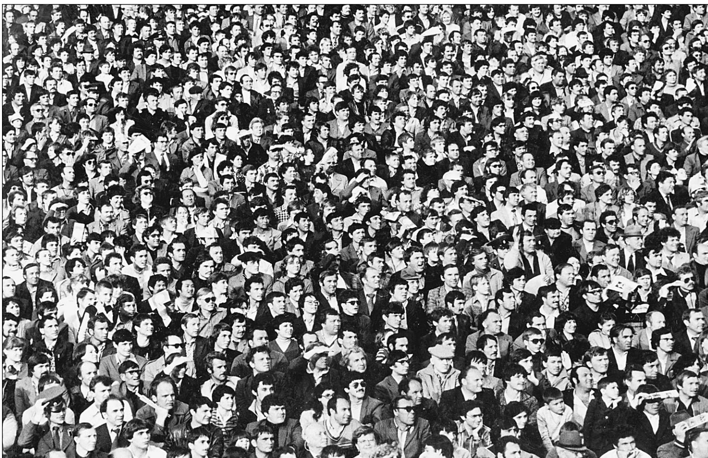
Население Российской Федерации. Фрагмент

Потому Госкомстат попытается убедить людей, что на основании переписи никто не собирается докладывать о суммах их доходов и что власть вовсе не интересуется фамилия, имя и отчество анкетироваемого. Государству просто важно понять, сколько российских граждан и иностранцев (их пересчитают тоже — см. справку) живет в стране. Эта информация позволит, быть может, даже скорректировать направление и характер экономических реформ, более адекватно расставить акценты в социальной политике, понимая, сколько в стране реально богатых и бедных, грамотных и неграмотных, имеющих доступ к национальной политике, с учетом особенностей национального состава российских регионов.