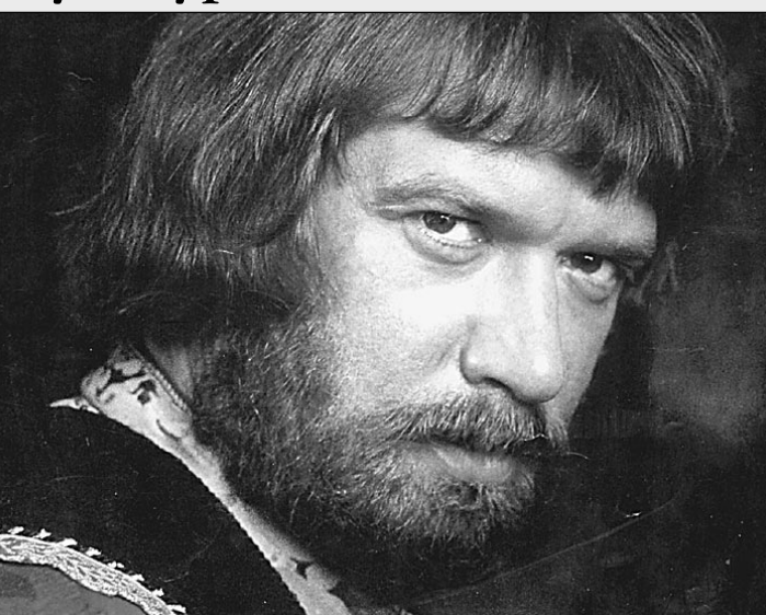
Владимир Машков вернулся из Голливуда во МХАТ