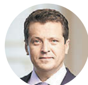
Ильдур Метшин, мэр Казани

Мы искренне рады и полны решимости провести незабываемый Суперкубок УЕФА. Казань – футбольный город, Россия – футбольная страна.