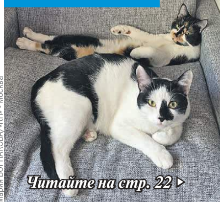
Мария ВОРНЯКОВА/«КП» - Москва