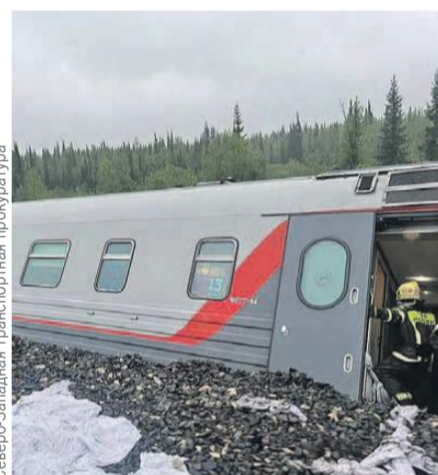
Северо-Западная транспортная прокуратура

«Выбирались через разбитые окна, вода лилась в перевернувшиеся вагоны»