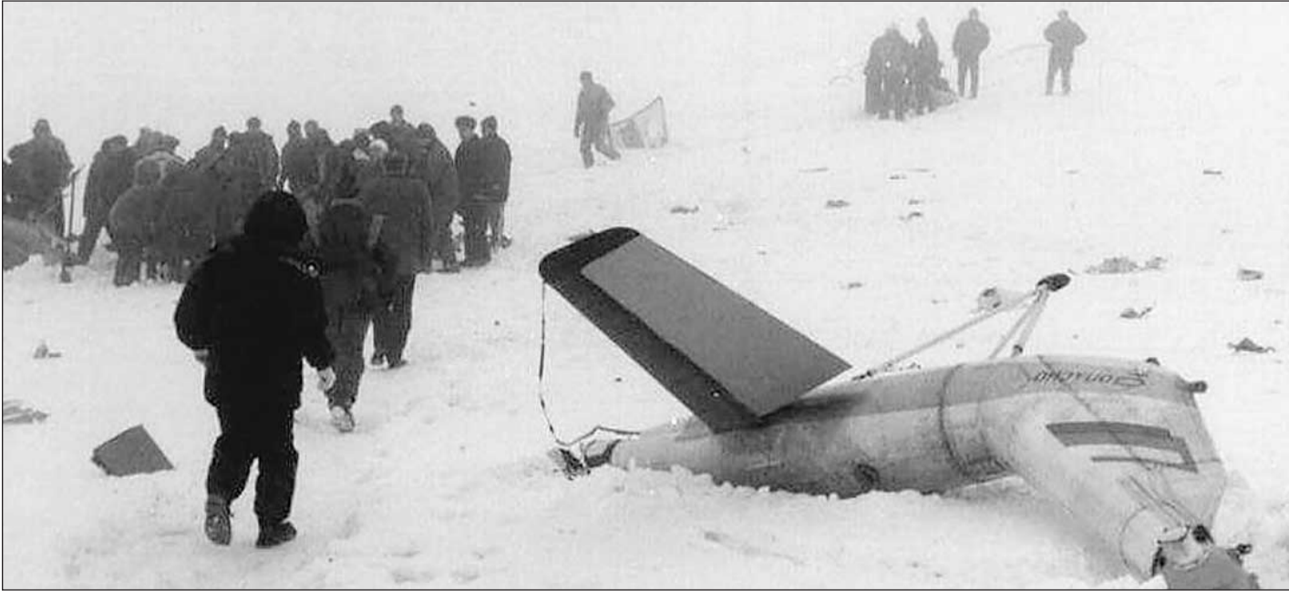
На месте катастрофы вертолета Ми-8