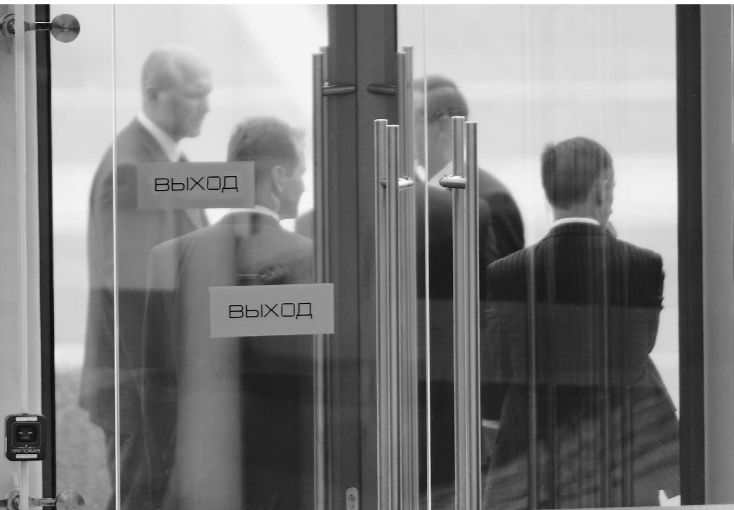
Госорганы пока сами не разобрались в том, насколько прозрачными им следует быть

Вопреки закону многие госорганы не раскрывают информацию о себе