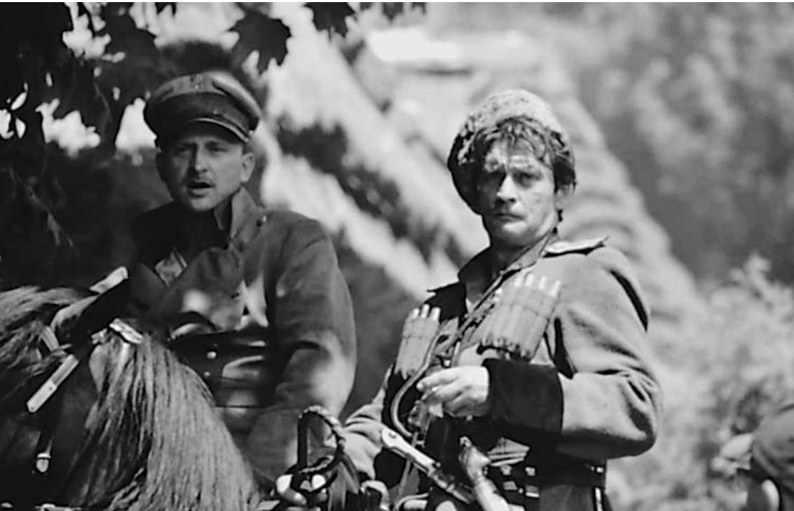
Польский актер Борис Шиц и наш Александр Домогаров в фильме «Варшавская битва. 1920 год»

ОФИЦИАЛЬНЫЕ (ЦЕНТРАЛЬНЫЙ БАНК РФ) КУРСЫ ВАЛЮТ К РУБЛЮ НА 17 НОЯБРЯ