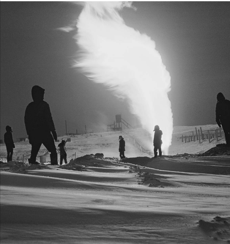
Запасы гидратов сосредоточены в основном в районах вечной мерзлоты

Коми — всего 1300 метров. Максимум, на что был рассчитан этот метраж, — посадка малых самолетов типа Ан-24. Кроме того, взлетно-посадочное поле было уже давно заброшено, поросло травой и кустарником. В этих невероятных условиях пилотам Ту-154, летевшим из Полярного в «Домодедово», удалось посадить самолет.