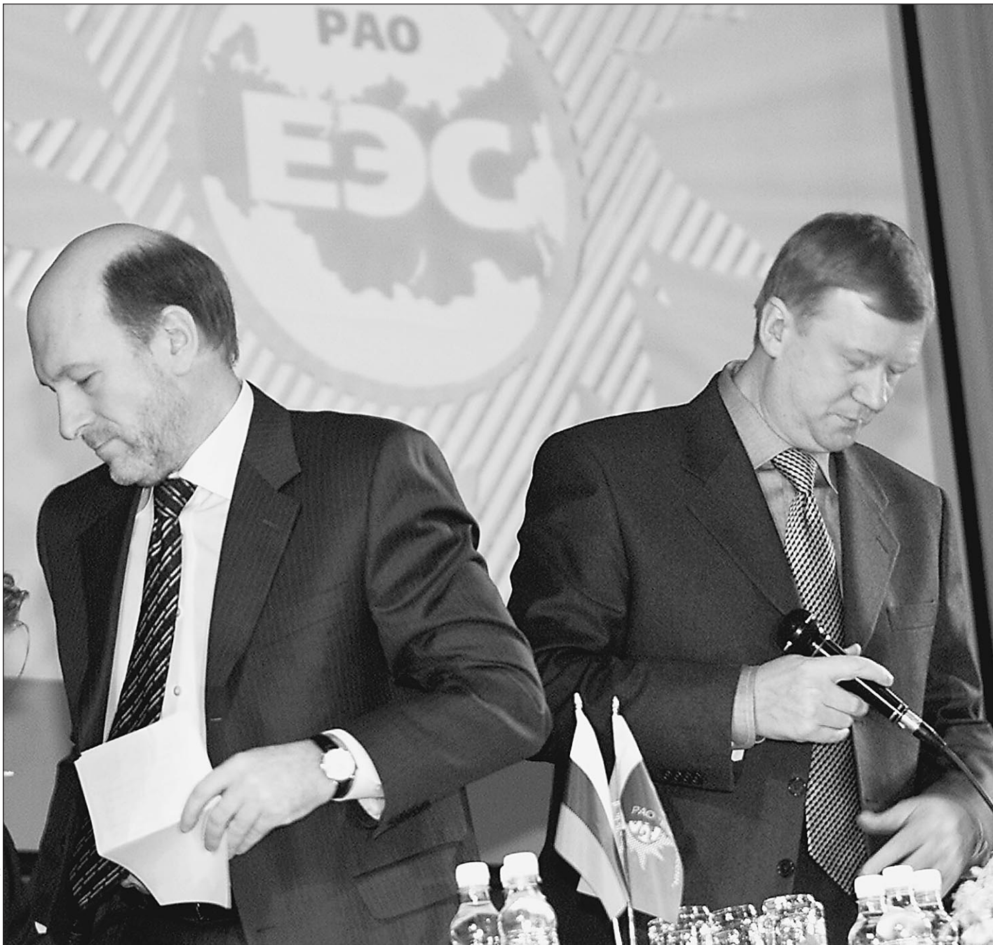
17 декабря. Москва. Конференция «РАО «ЕЭС России» — открытая компания». В президиуме — председатель совета директоров РАО Александр Волошин (слева) и председатель правления Анатолий Чубайс

Валентин ЗАВАДНИКОВ, председатель комитета по промышленной политике Совета Федерации: «После трех лет публичной дис-