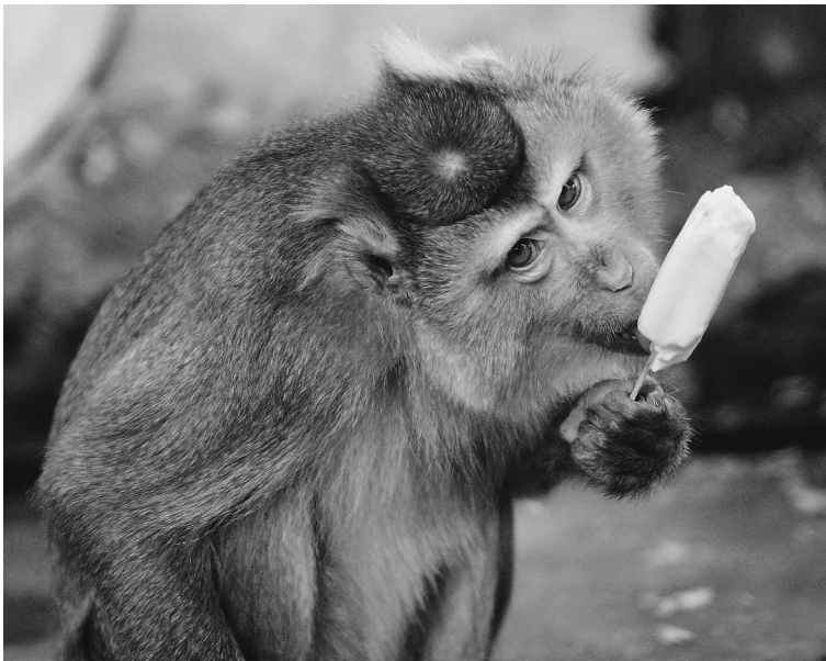
Животные приспосабливаются к жаре, как люди, — едят мороженое

водилось никакой профилактики, в результате часть подземных источников запесочилась.