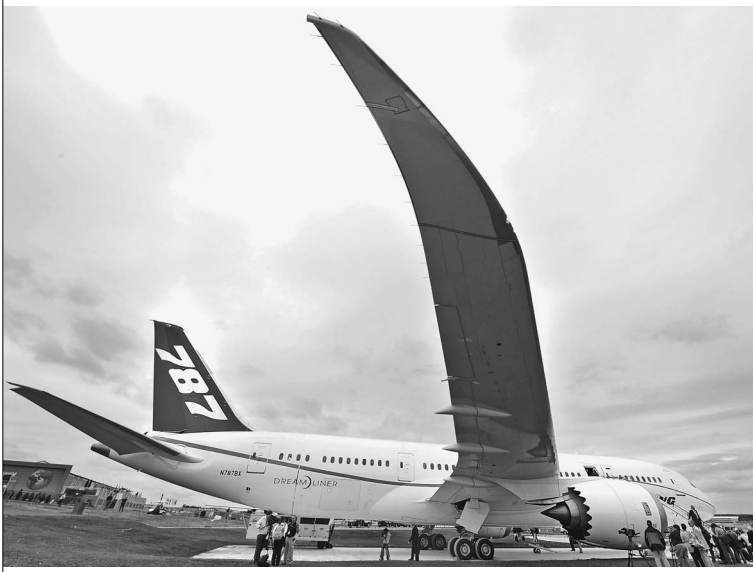
Аэропорт пригорода Лондона Фарнборо вчера принимал новинки авиапрома. Одна из них — Боинг-787