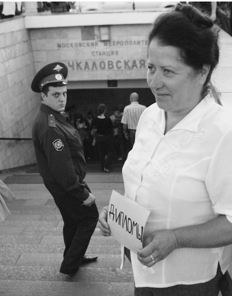
В таком «вузе» диплом можно получить за один день

Каждый третий документ о высшем образовании — подделка