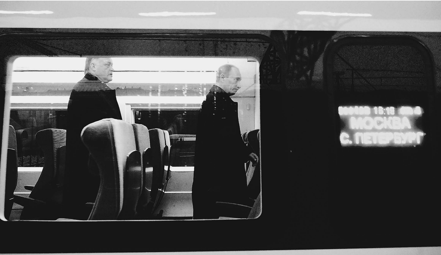
Современные поезда стали одним из главных способов привлечения в Россию новых технологий

Владимир Якунин рассказал «Известиям» о перспективах скоростных поездов, о модернизации и о морали