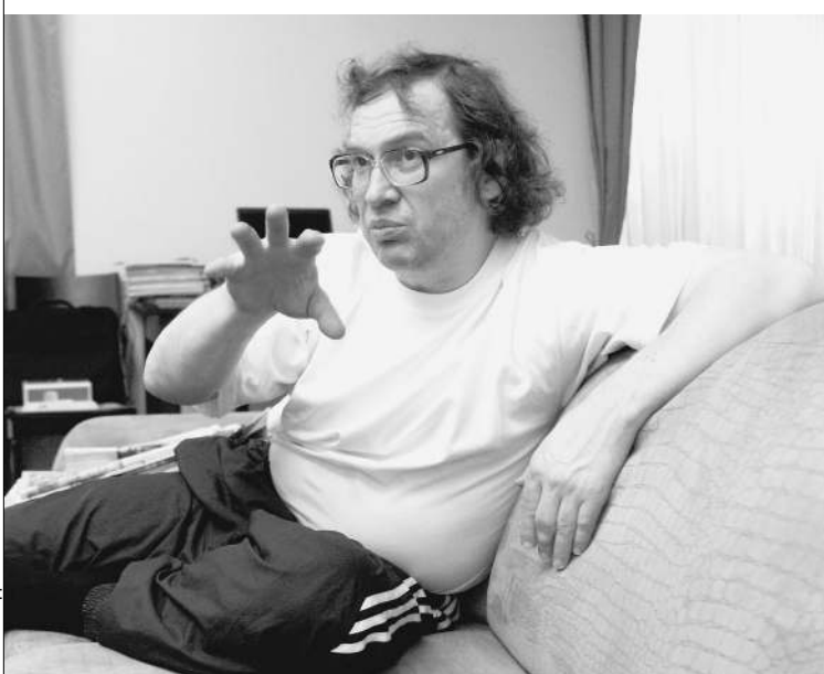
Сергей Мавроди через сутки после освобождения

о: Формально за то, что мы на Пасху в чайнике жарили котлеты. А на самом деле это такая уловка: из карцера более упрощенная процедура выхода из СИЗО. Да и в карцере-то не сидел — он был на ремонте. Меня посадили в трехместную хату, и я там хорошо отдохнул. → стр. 2