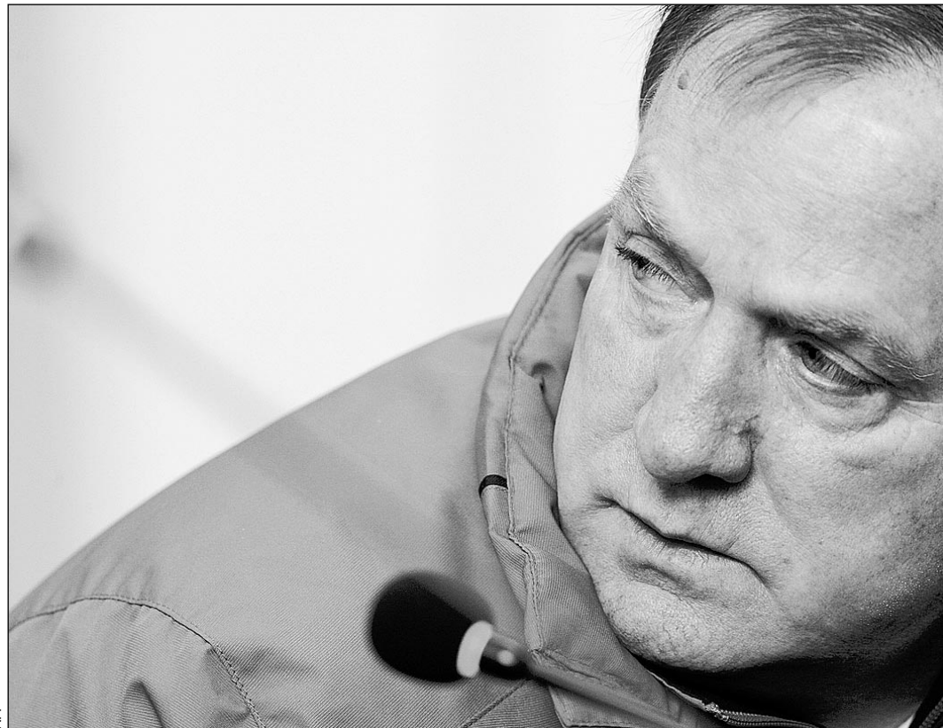
Вчера. Санкт-Петербург. Главный тренер «Зенита» ДИК АДВОКАТ.