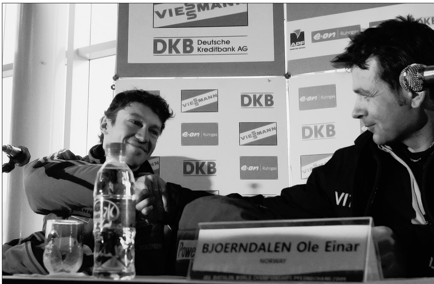
Вчера. Пьонгчанг. Пресс-центр чемпионата мира. Рукопожатие Максима ЧУДОВА и Оле Эйнара БЬОРНДАЛЕНА.