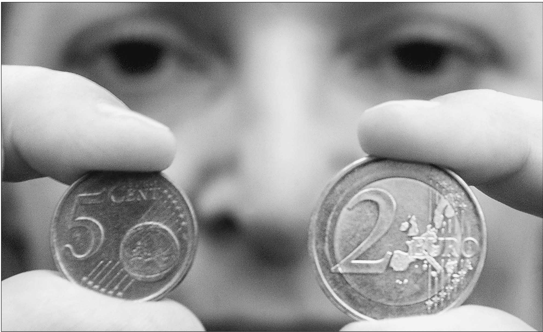
Не было ни доллара — да вдруг евро

Что касается бюджета — правительство предполагает, а Центральный банк располагает. Дело в том, что за курс доллара и инфляцию отвечает именно ЦБ, а ЦБ по закону у нас независим. Два года назад у правительства и Центрального банка были серьезные разногласия по поводу инфляции и курса доллара в 2000 году — дело дошло до публичной войны с участием Госдумы. Год назад правительство и Центральный банк долго согласовывали совместную позицию. В этом году согласования не понадобились. Глава ЦБ Виктор Геращенко заявил, что при выработке своей позиции Банк России будет ориентироваться на бюджетные показатели.