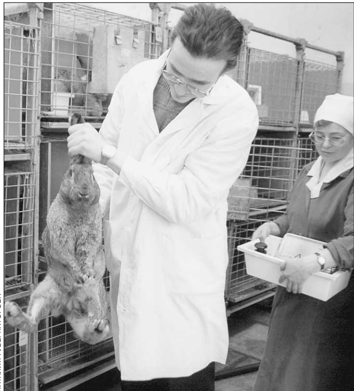
Микробиологи из Подмосковья не платят за свет и покупают импортных кроликов для опытов