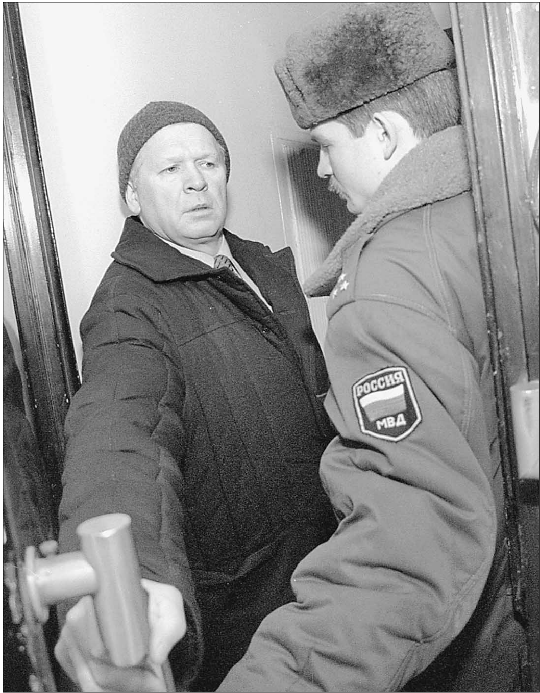
Милиционеры и охранники традиционно не ладят друг с другом

Частные охранники объявили войну Пермскому ГУВД