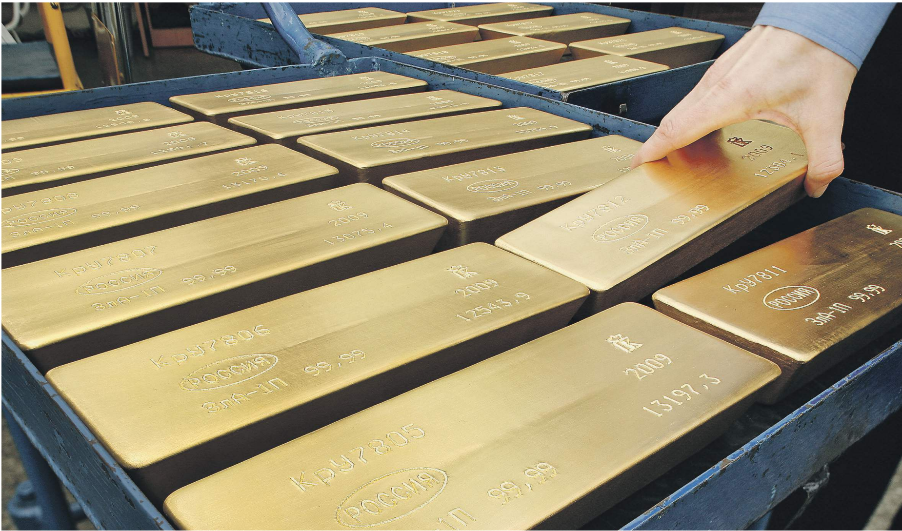
Золотовалютные резервы могут уменьшиться на $37,6 млрд в случае выкупа госдолга у нерезидентов

Из-за возможных ограничений со стороны США внешняя задолженность сократится