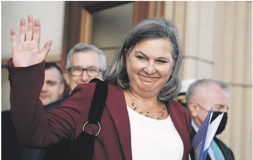
Кристина Корнилова / Известия