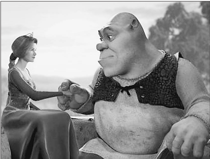
Кадр из фильма «Шрек»