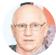
Валерий Баринов , народный артист России, болельщик «Локо»