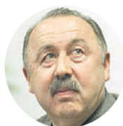
Валерий Газзаев , титулованный российский тренер, победитель Кубка УЕФА, депутат Государственной думы

Как о примере того, с каким хладнокровием, оказывается, можно вытереть ноги о собственных болельщиков. Са-