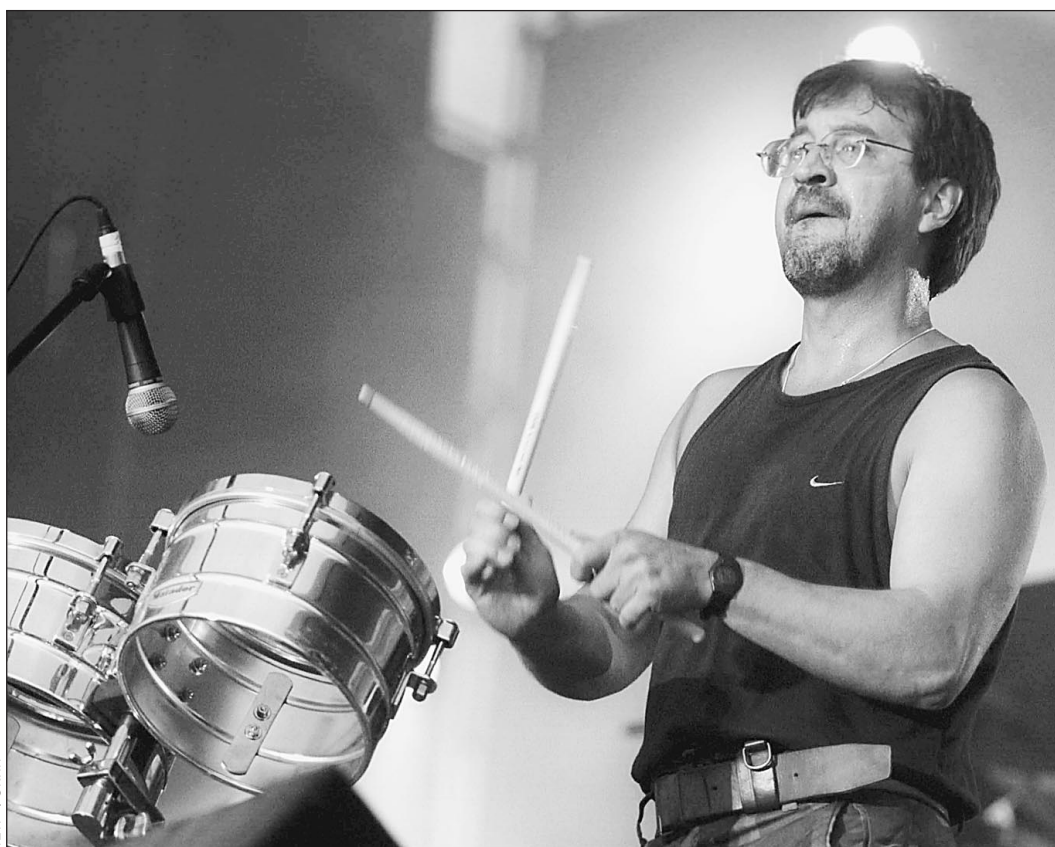
Все это — рок-н-ролл (Юрий Шевчук на фестивале «Нашествие-2001»)

Потом было почти по Жванецкому: теперь кульмассовая работа. Артисты до сих пор здесь,