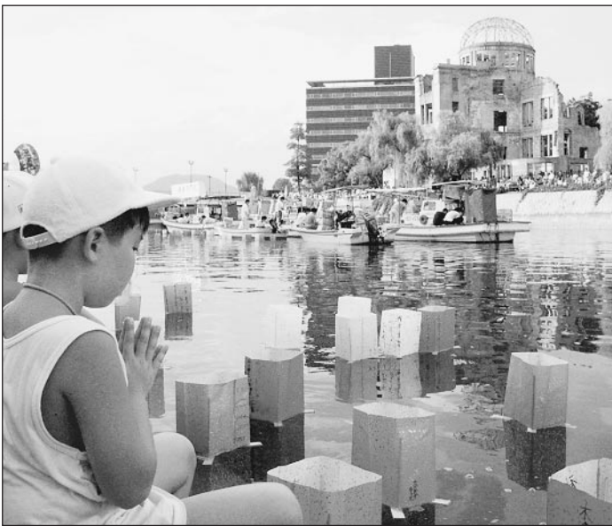
Хиросима. XXI век

Мы передаем кому-то ядерные технологии. Но достаточно ли мы оберегаем Природу от последствий развития атомной индустрии? Свод законов об экспорте в страну ОЯТ вновь напомнил о нашей ответственности. А бесконечные ядерные свалки — в море, под землей,