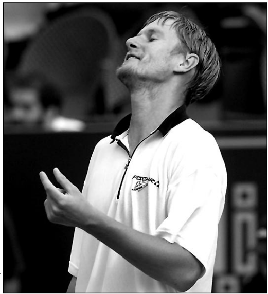
Вчера. Рим. Евгений КАФЕЛЬНИКОВ.

Несмотря на эту неудачу, шансы Кафельникова остаться первой ракеткой мира еще минимум на три недели после вчерашнего дня даже возросли. Дело в том, что самый опасный его преследователь - испанец Карлос Мoya (6) неожиданно уступил аргентинцу Франко Скилларди - 3:6, 5:7. Теперь обойти Кафельникова в ближайший понедельник может только австралиец Патрик Рафтер (4), одолевший в четвертьфинале с небольшой травмой американца Андре Агаси (14) - 6:1, 7:6 (7:4). Однако для того чтобы возглавить мировой рейтинг, Рафтеру необходимо выиграть этот турнир, а в его активе пока нет ни одного титула, добытого на грунтовом покрытии. Следующим соперником двукратного победителя US Open будет полуфиналист январского Открытого чемпионата Австра-